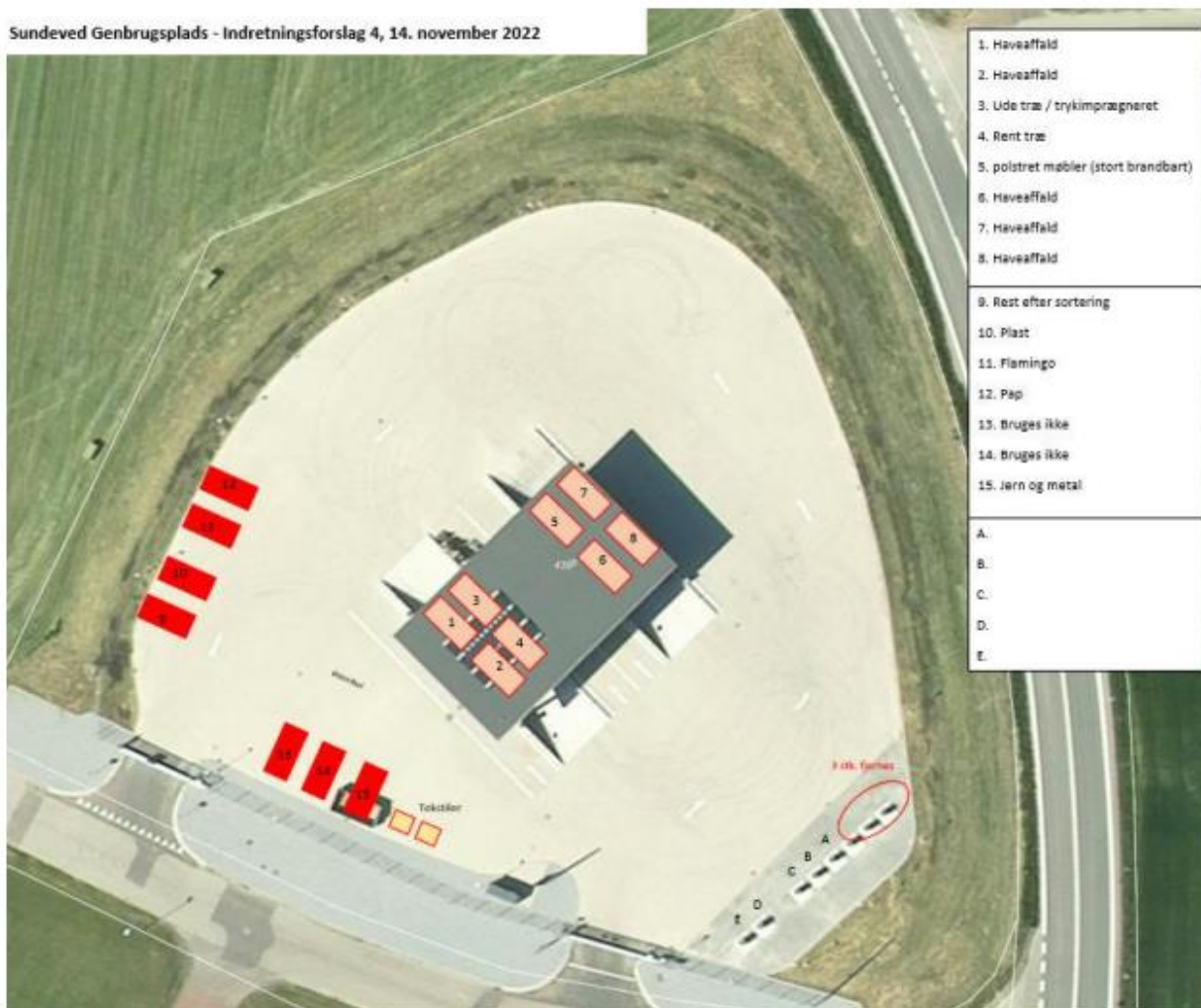
Figur 2 Indretningsforslag til Sundeved Genbrugsplads

Sundeved Genbrugsplads - Indretningsforslag 4, 14. november 2022