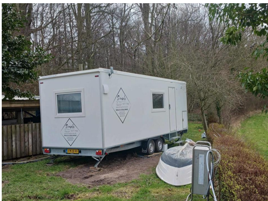
Foto som viser den midlertidige beboelsesvogn.