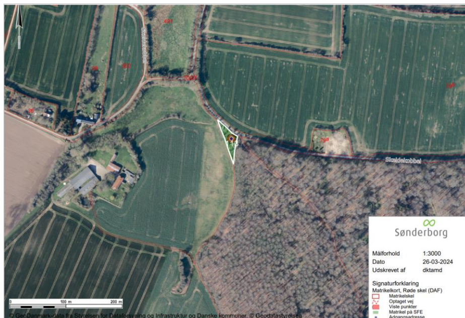
Oversigtskort som viser ejendommens placering på matr.nr. 113, Skelde, Broager.

Du har søgt om tilladelse til midlertidig beboelsesvogn på 17 m 2 , på ejendommen som ligger på adressen Skeldekobbel 22, Skelde, 6310 Broager.