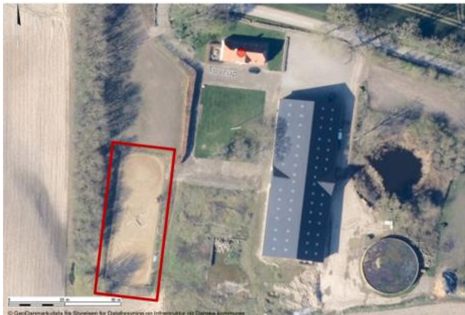
Situationsplan som viser placeringen af ridebanen på ejendommen.