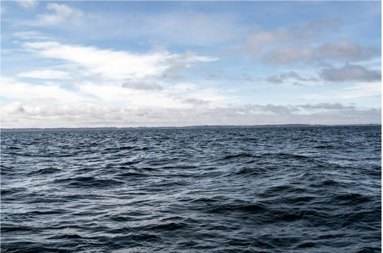
Billede 1: Eksisterende forhold af projektområdet taget 6 km fra pierens længderetning ude i Lillebælt.