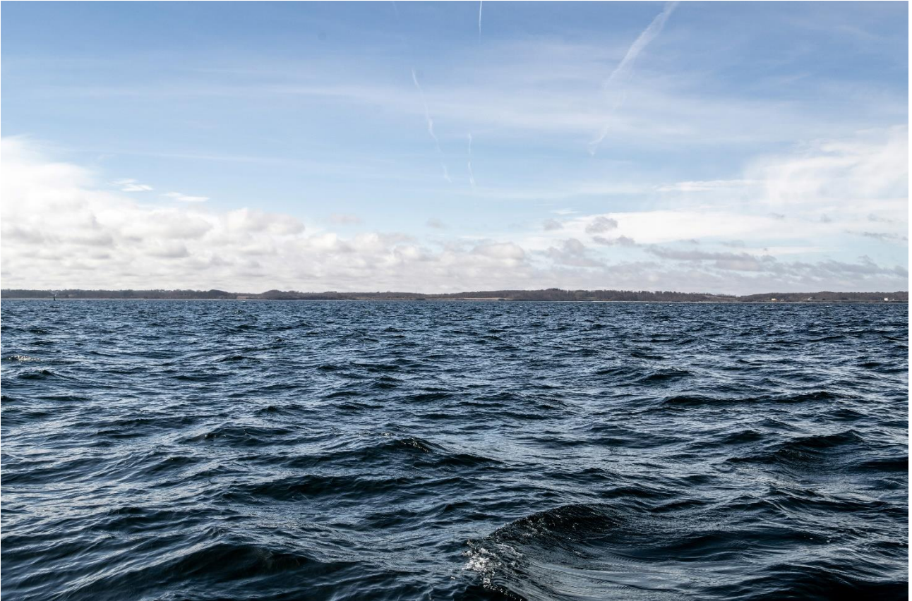
Billede 3: Eksisterende forhold inden for projektområdet taget 3 km fra pierens længderetning ude i Lillebælt.