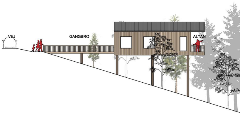
Figur 2: Tilpasset principtegning for hvordan pælehusene kan se ud med afsæt i de præciserede lokalplanbestemmelser.

Bebyggelsen inden for dallandskabet, herunder pælehusene, vurderes i sin helhed i miljørapporten at kunne medføre en væsentlig påvirkning. Det er dog kommunens vurdering, at påvirkningen kan mindskes med afbødende tiltag i form af en præcisering af lokalplanens bestemmelser for området inden for det beskyttede landskab. Således præciseres lokalplanbestemmelserne for så vidt angår afskærmende beplantning omkring pælehusene og bygningernes størrelse og visuelle udtryk, så påvirkningen lokalt nedbringes til et moderat niveau inden for det pågældende landskabsrum.