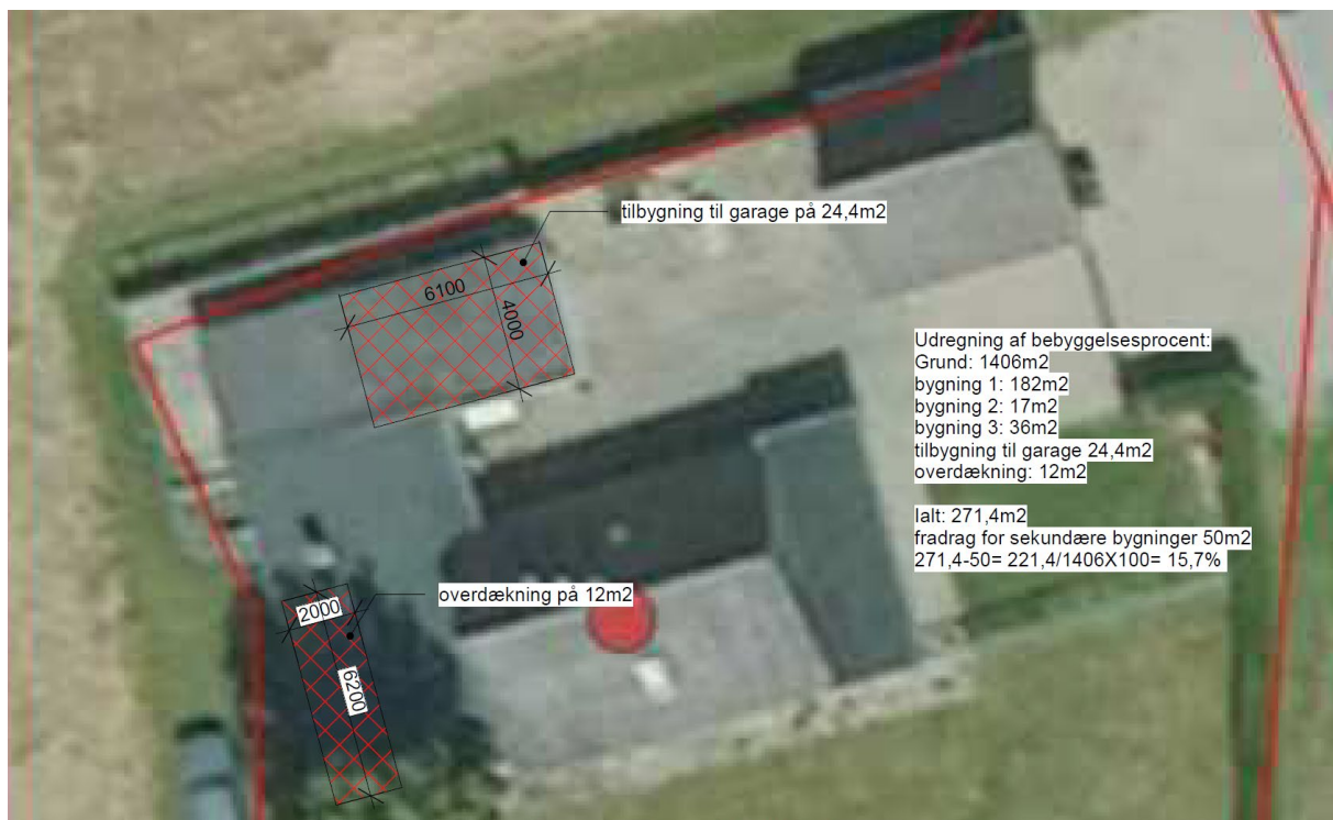
Tilbygning til garage markeret med rød skravering. Overdækningen kræver ikke landzonetilladelse