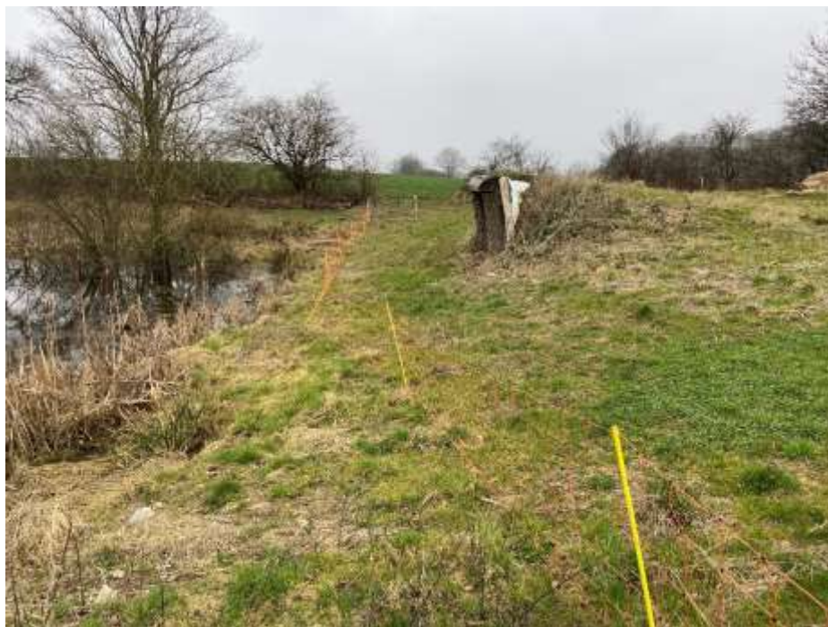
Foto som viser fåreskjulet fra siden.