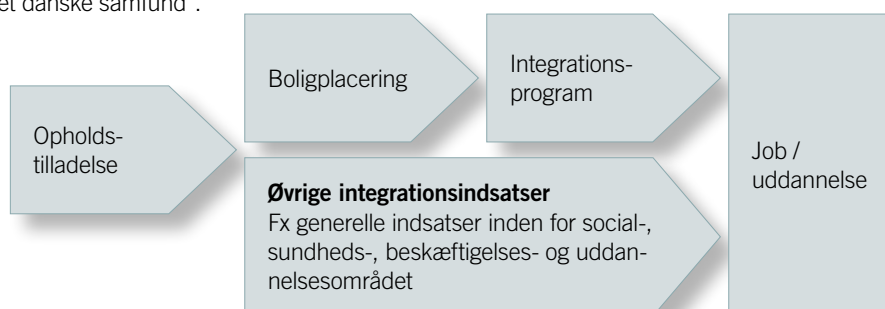
Figur 1: Model for integrationsindsatsen.

Integrationsstrategien realiseres bedst ved hjælp af en helhedsorienteret og koordineret indsats. En tværfaglig indfaldsvinkel og særlig opmærksomhed på samarbejde på tværs af forvaltninger og til eksterne aktører.