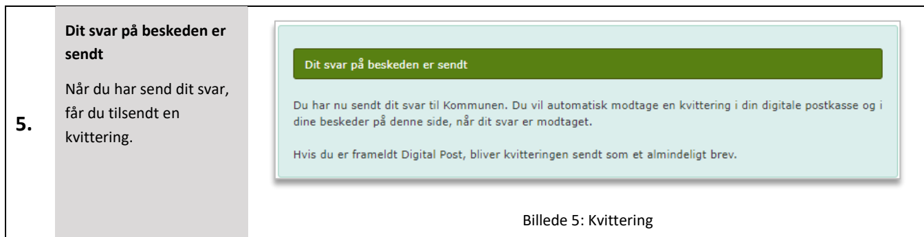
Billede 5: Kvittering