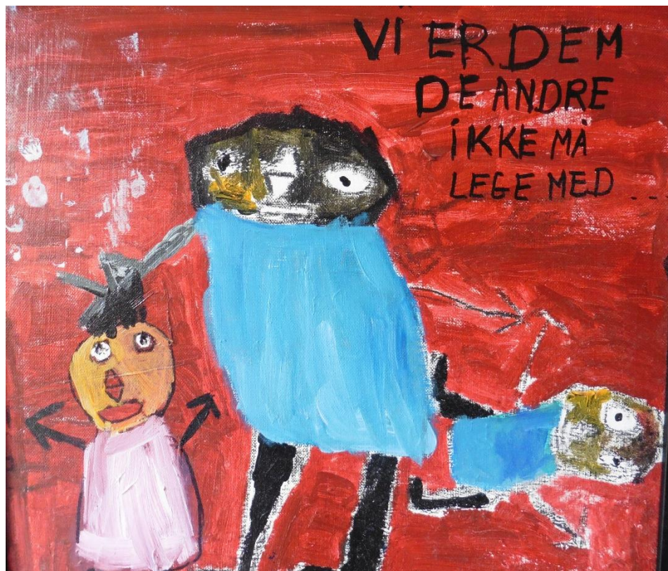
Malet af borger på BSI