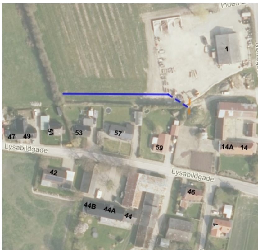
Figur 2.: Projekttegning med grøft, rørlagt pvc-ledning og eks. rør