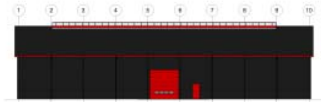
Facade 1, mål 1:200