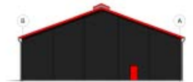
Gavl 2, mål 1:200