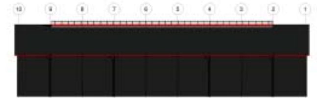
Facade 2, mål 1:200