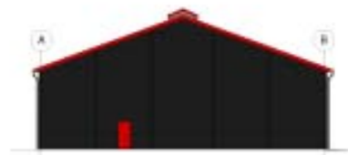
Gavl 1, mål 1:200