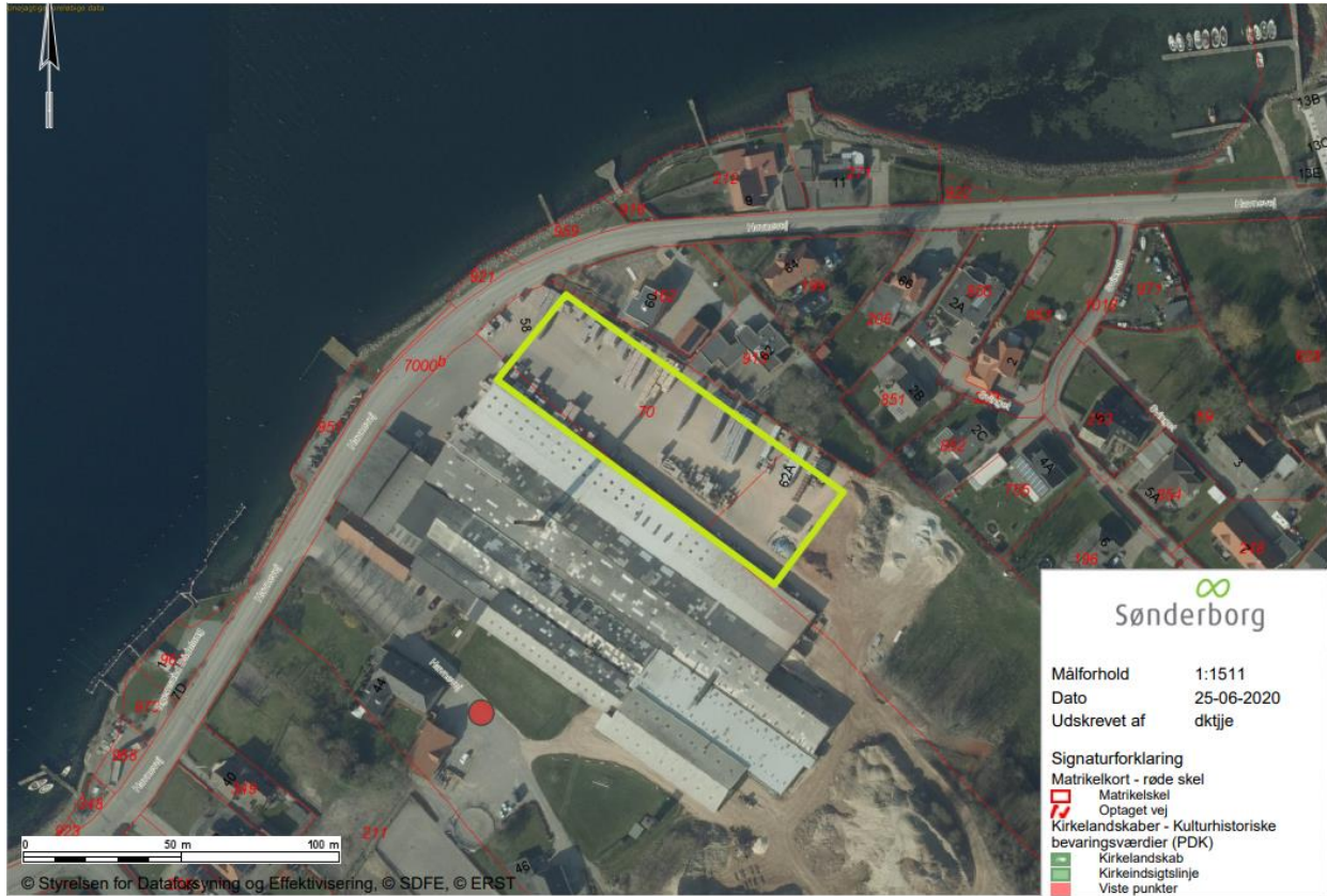
Figur 1. Skitse af det overdækkede areal på ca. 3800 m 2 , lavet på baggrund af skitse fra ansøgningen. Overdækningen måler 36 x 108 meter.