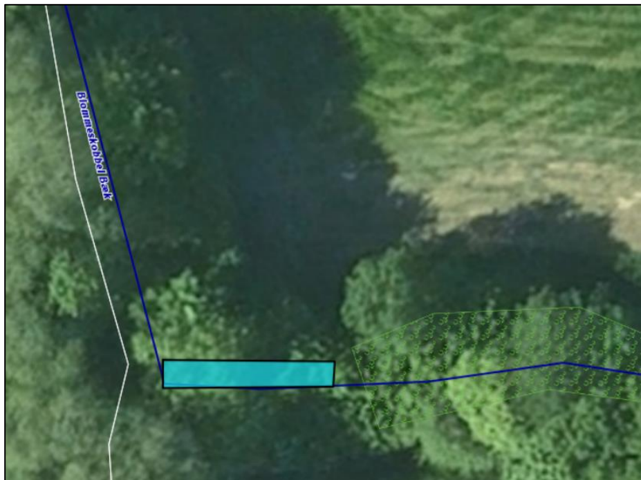
Figur 1. Sandfanget etableres fra sammenløbet af Blommeskobbel Bæk og rørdløbet fra røret under Østkystvejen frem til, hvor fredskoven begynder. Sandfanget dimensioneres til 2 x 12 m.