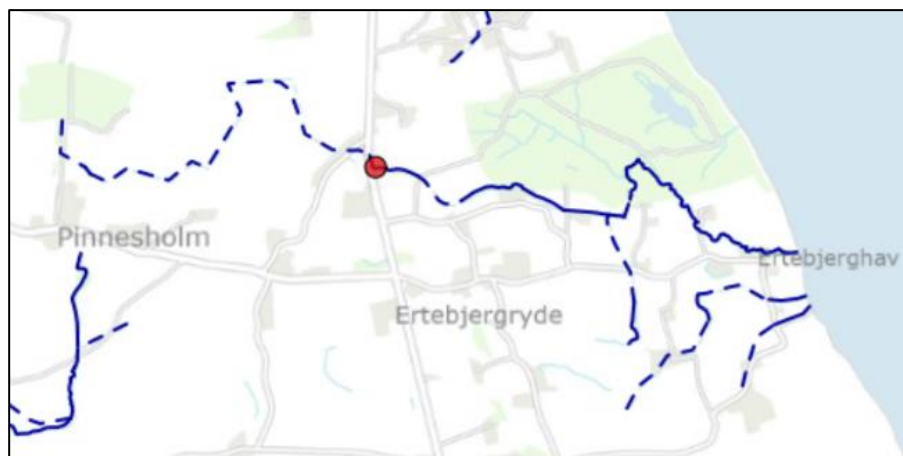
Figur 1. Oversigtskort med placering af det planlagte sandfang.