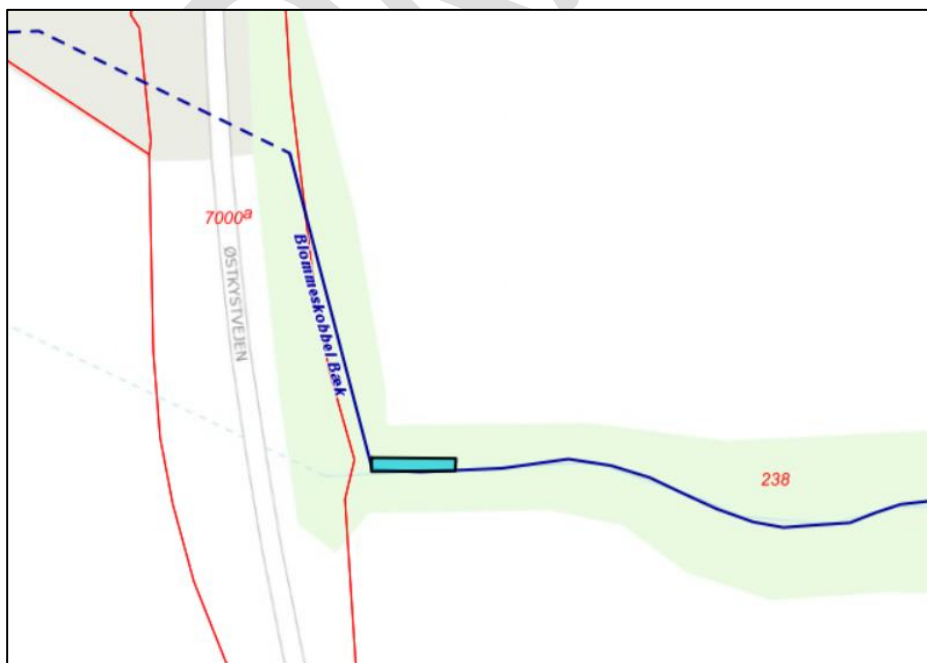
Figur 2. Oversigtskort med matrikel nr. og planlagt sandfang markeret med lyseblå.