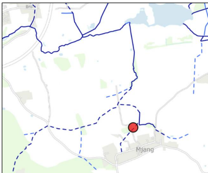
Figur 1. Oversigtskort med placering af det planlagte sandfang.