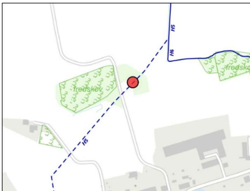
Figur 2. Beskyttede naturtyper og vandløb jf. Naturbeskyttelsesloven § 3.

Det er vurderet, at etablering af det planlagte sandfang ikke vil påvirke naturen i og omkring H5 – hverken ved etablering eller ved den kontinuerte tømning.