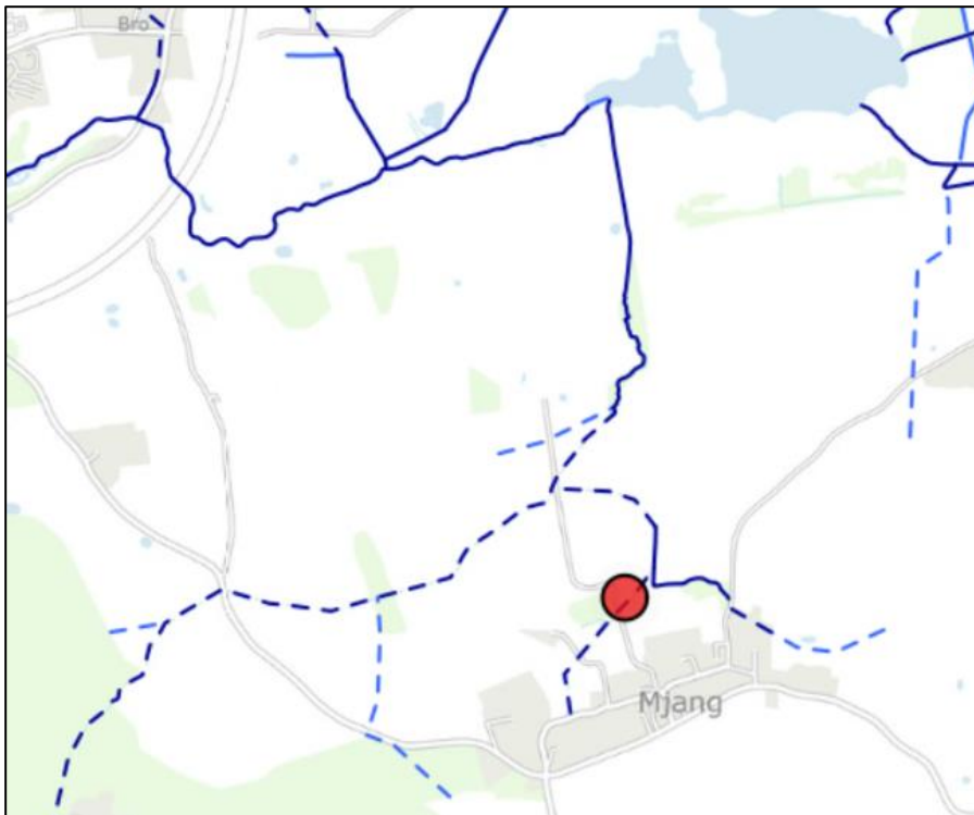
Oversigtskort, projektområdet (markeret med rød cirkel)

Projektet ønskes etableret på matrikel nr. 10, Mjang, Hørup, nær Mjang (se nedenstående oversigtskort).