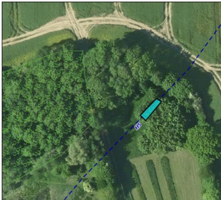
Figur 1. Sandfang etableres på åbent strækning nær grusvej med en dimension på 2 x 12 m.