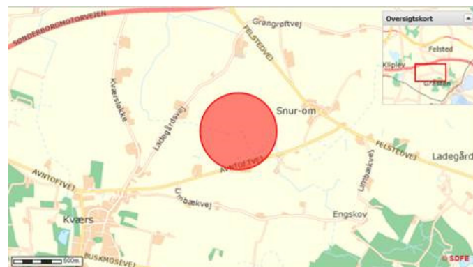
Placering af biogasanlæg ved Kværs.

Placeringen af det kommende biogasanlæg er sket ud fra en lang række hensyn. Der er bl.a. gode logistik og infrastrukturforhold, gode muligheder for tilslutning til det eksisterende naturgasnet samt et stort biogaspotentiale i biomasser fra nærområdet. Derudover har det også haft stor betydning, at anlægget bliver placeret i passende afstand til bebyggelse og særlige naturområder.