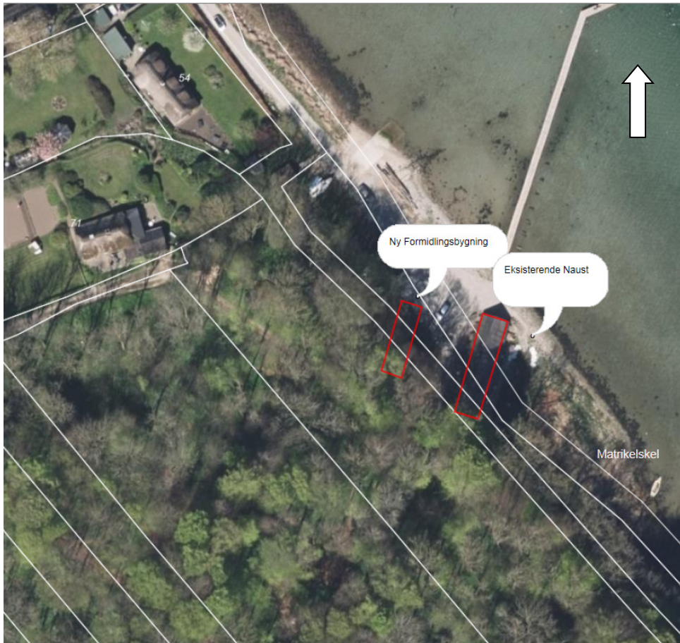
Luftfoto 2016 med placering af den nye formidlingsbygning. De hvide streger markerer matrikelskel.

I forbindelse med Kystdirektoratets sagsbehandling af dispensation fra strandbeskyttelseslinjen er størrelsen på formidlingshuset reduceret i forhold til den oprindelige ansøgning. I samme forbindelse er formidlingsbygningen blevet tilføjet et offentligt toilet og et offentligt madpakkerum.