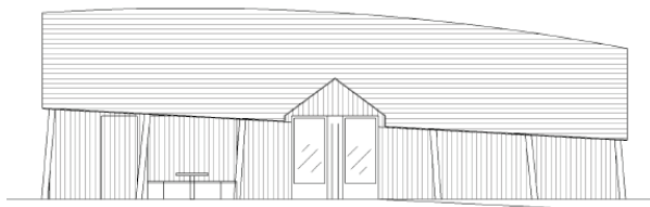
Facade mod syd

I forbindelse med den nye formidlingsbygning ved Nausten i Sottrupskov, har Sønderborg Kommune undersøgt muligheden for skiltningen i forhold til parkeringspladsen. Der er i dag ikke skiltet med P-tavler ved den offentlige Parkeringsplads for enden af Sottrupskov, og dette vil blive bestilt hurtigst muligt. Selskabet for Nydamforskning skal henvise besøgende til at parkere på den offentlige parkeringsplads. Forholdene i dag gør det ikke muligt for busser at parkerer ved formidlingsbygningen og dette forhold laves ikke om. Den eksisterende lille grusbelagte p-plads ved nausten bliver indskrænket, da formidlingsbygningen placeres hen over arealet. Hvis det på sigt viser sig at blive et problem med at besøgende til formidlingsbygningen og nausten kører helt ned til bygningen for at parkere, har kommunen mulighed for at supplere med flere skilte.