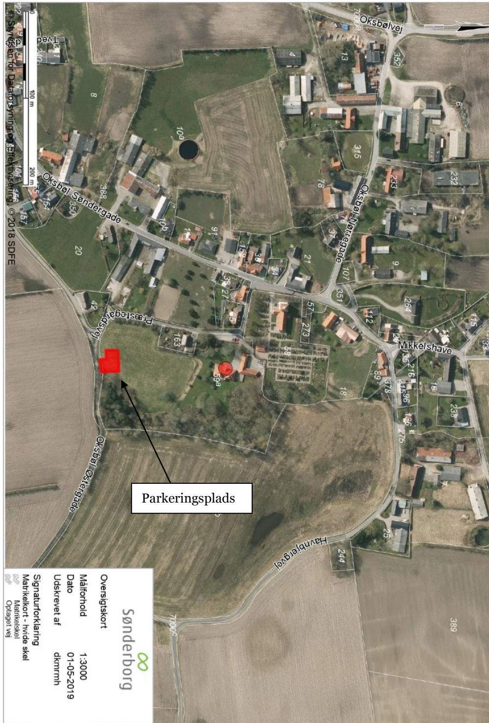
Billede 1. Oversigtskort. Der er med rødt markeret den omtrentlige placering af Parkeringspladsen.