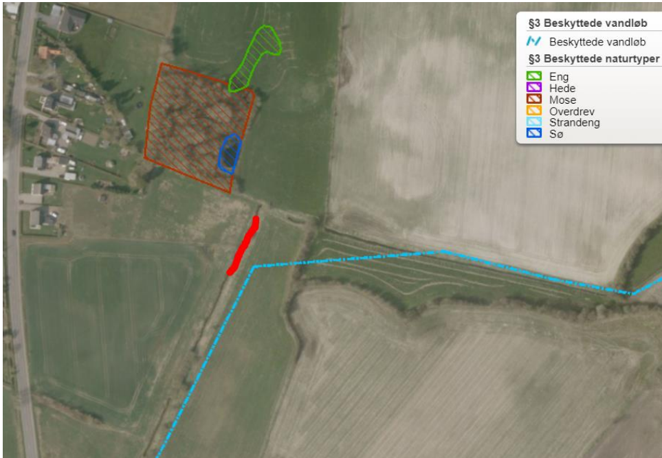
Oversigtskort 1. Beskyttede naturtyper og vandløb jf. Naturbeskyttelsesloven § 3. Den røde streg på kortet svarer til lokaliteten for det planlagte sandfang.

Det er vurderet, at etableringen af det planlagte sandfang, ikke vil påvirke naturen i og omkring Gejl Å – hverken ved etablering, eller ved den kontinuerte tømning.