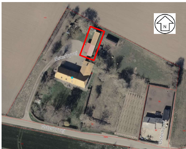
Oversigtskort som viser ejendommen – matr.nr. 53, Nygård, Kegnæs

Du har søgt om landzonetilladelse til lovliggørelse af ca. 20 m 2 tilbygning til den eksisterende garage (BBR2), på ejendommen som ligger på adressen Østerbyvej 4, 6470 Sydals.