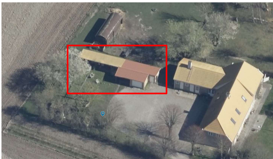
Skråfoto af ejendommens bebyggelse hvoraf udhusbygningen lovliggøres

Tilbygningen til udhuset sker i de samme materialer som eksisterende udhus og i umiddelbar forlængelse af eksisterende bygning. Tilbygningen forøger det fremtidige samlede areal til 73 m 2 , BBR-bygning 2.