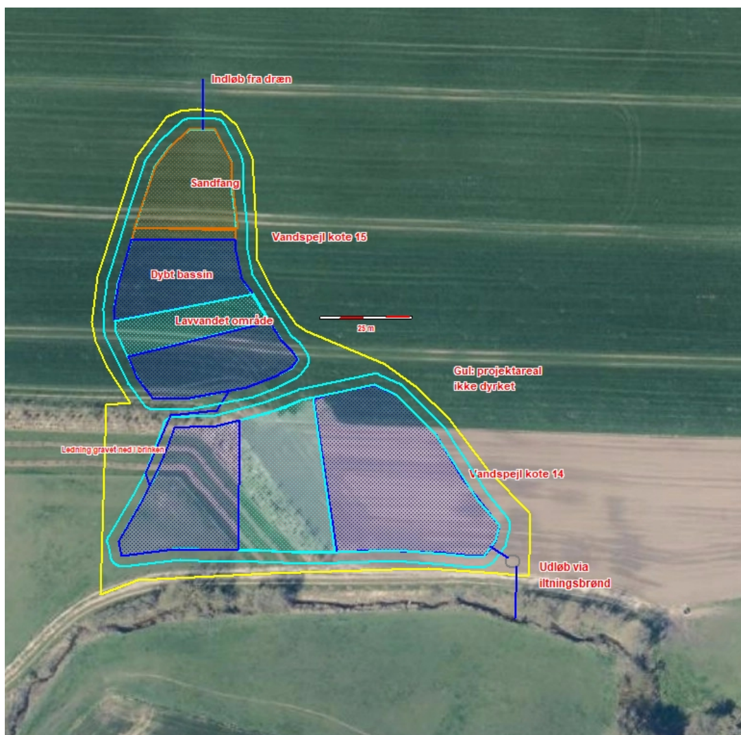
Figur 2. Detailprojektering af minivådområde og med udløb til Fiskbæk markeret.