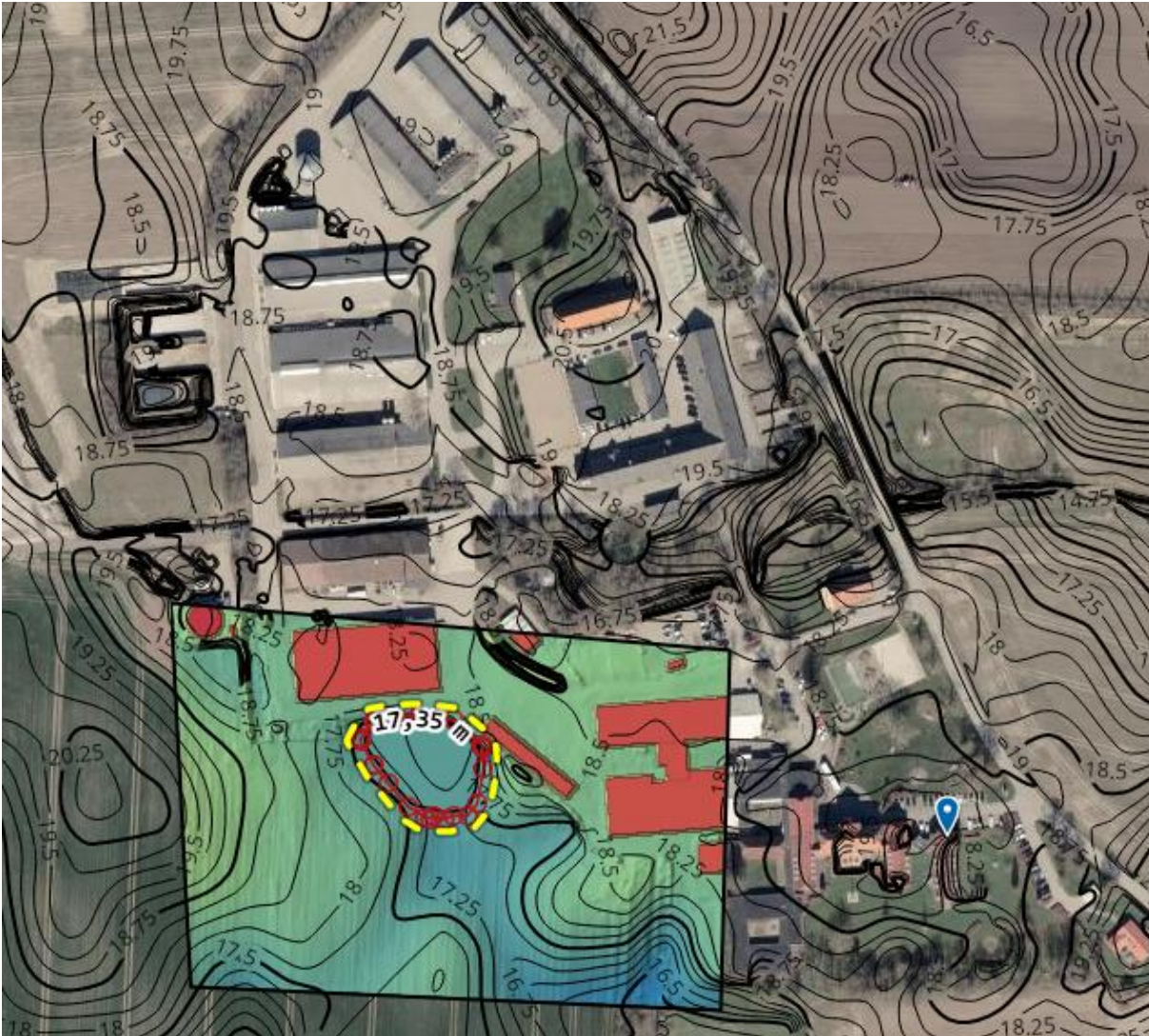
Figur 1 viser de områder som Sønderborg Kommune vurderer, vil opnå landbrugsmæssig forbedret drift i forbindelse med terrænregulering af i alt 0,14 ha.