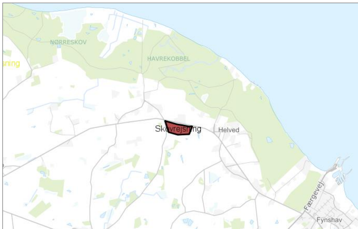
Skovrejsningsarealet er markeret med rødt.