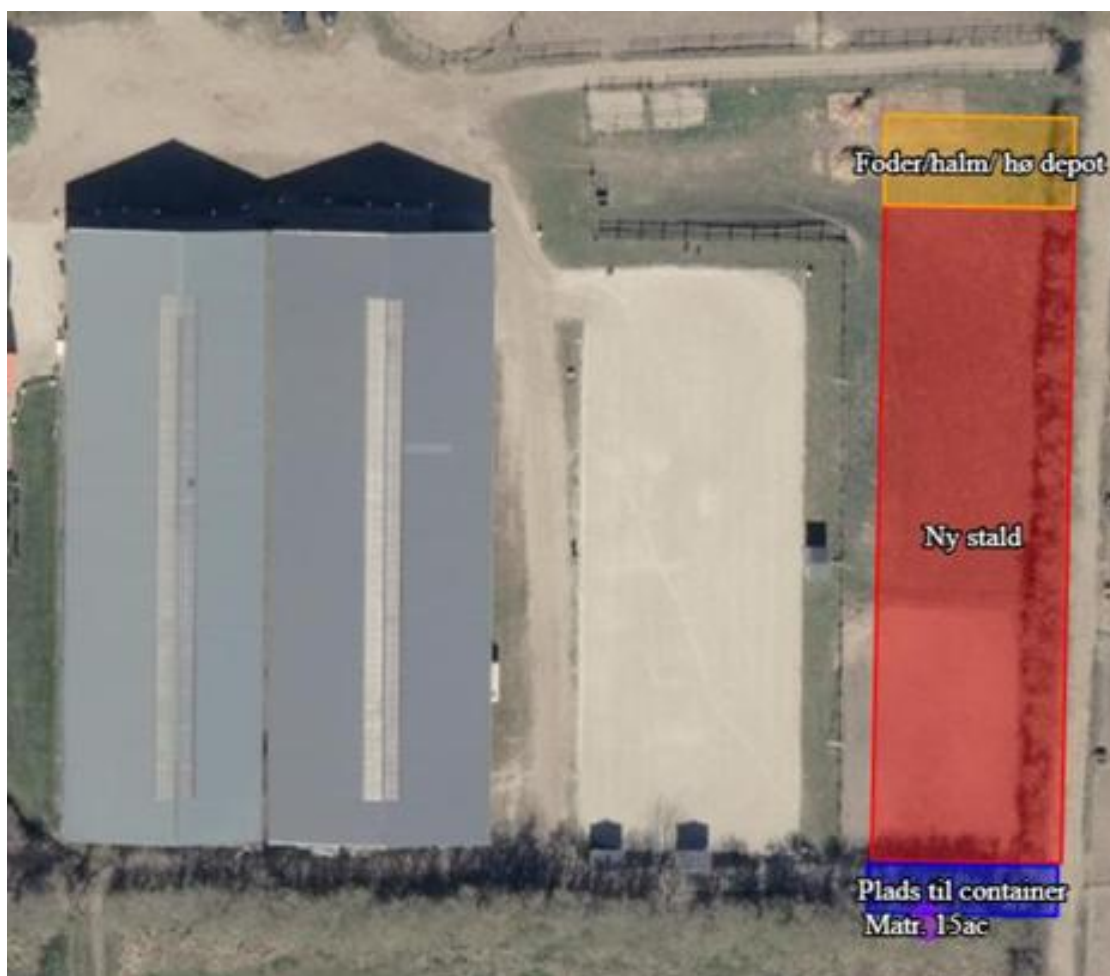
Placering godkendt i miljøtilladelsen, markeret med blå.