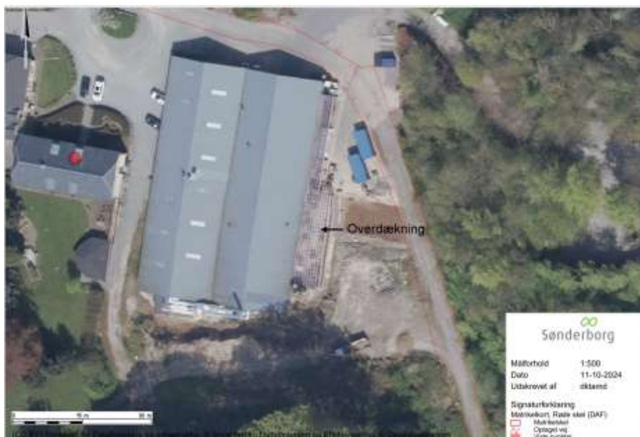
Luffoto som viser overdækningen på bygningen.