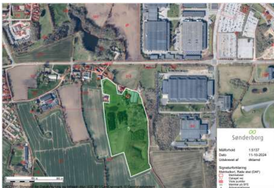
Oversigtskort som viser ejendommen – matr.nr. 5, Lunden, Havnbjerg.

Du har søgt om landzonetilladelse til lovliggørelse af overdækning på 120 m 2 , på ejendommen som ligger hos PLR Production på adressen Bærensmøllevej 4, Lunden, 6430 Nordborg.