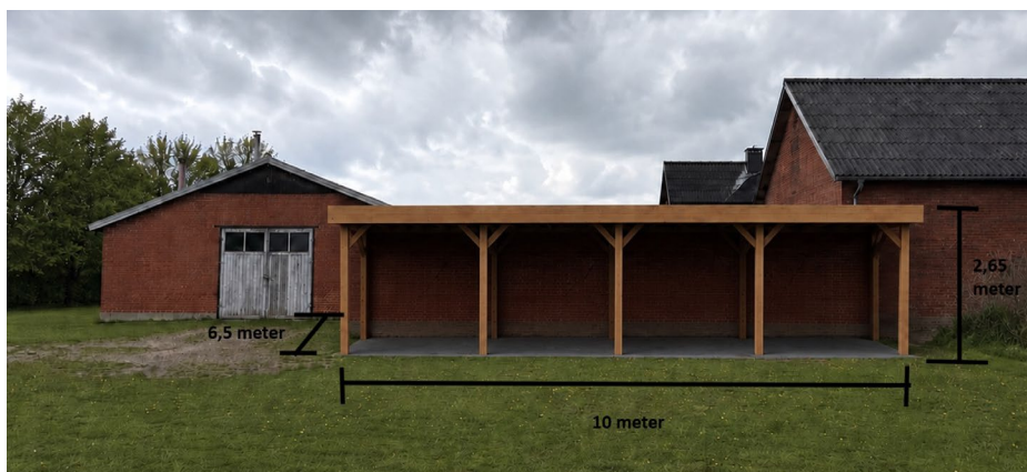
Målsat visualisering af ansøgt carport fra ansøgningen