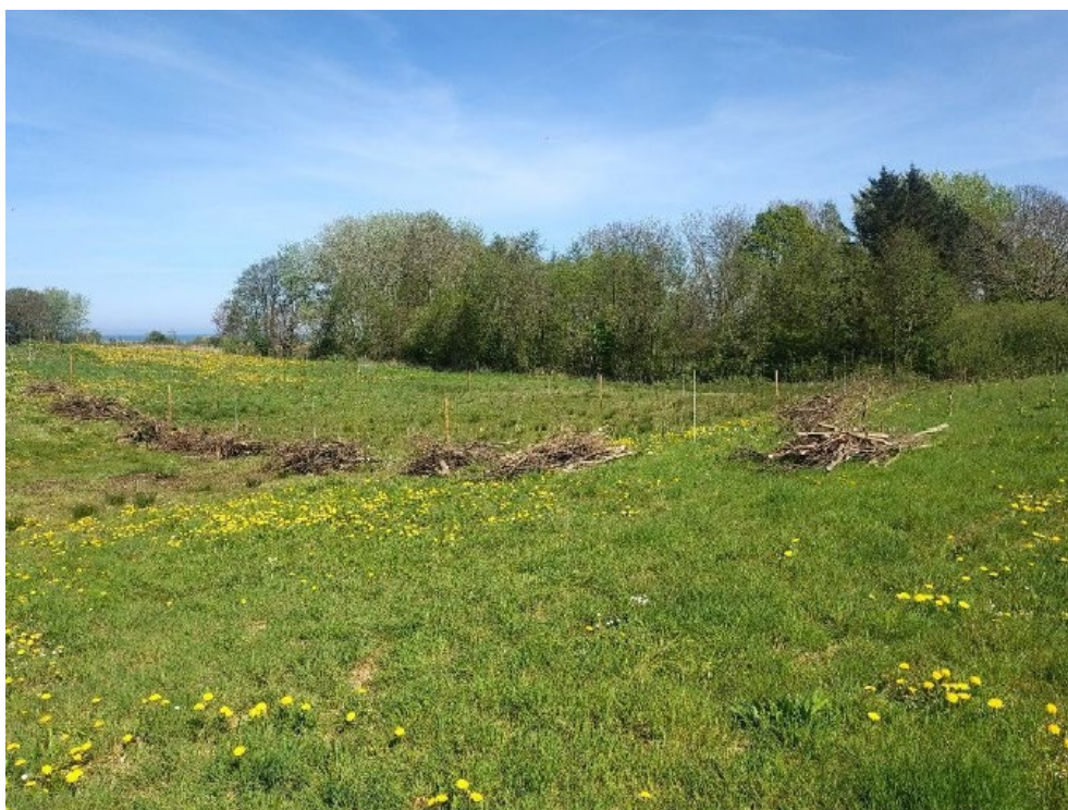
Figur 13. Kvasbunker ved placering 2