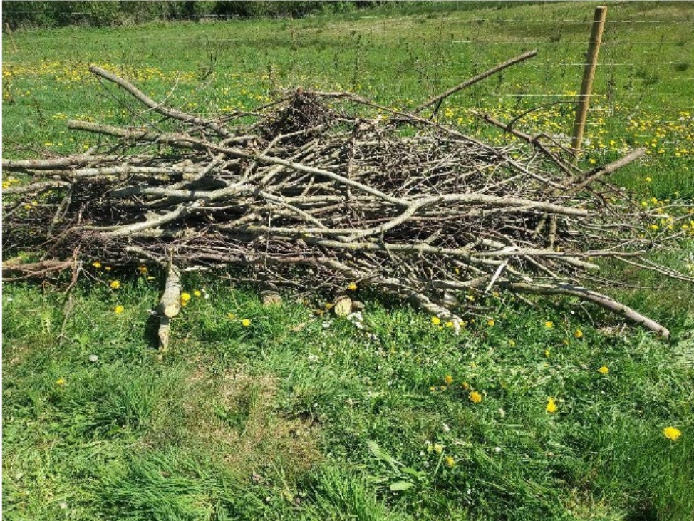
Figur 17. Kvasbunke ved placering 4