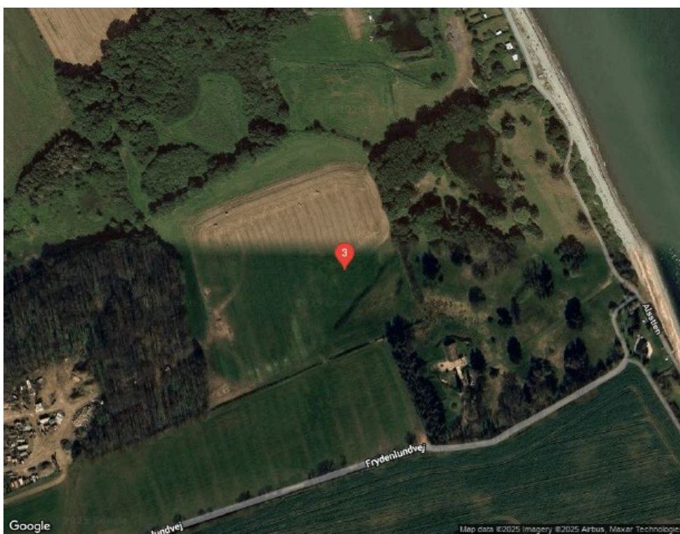
Figur 14. Placering 3