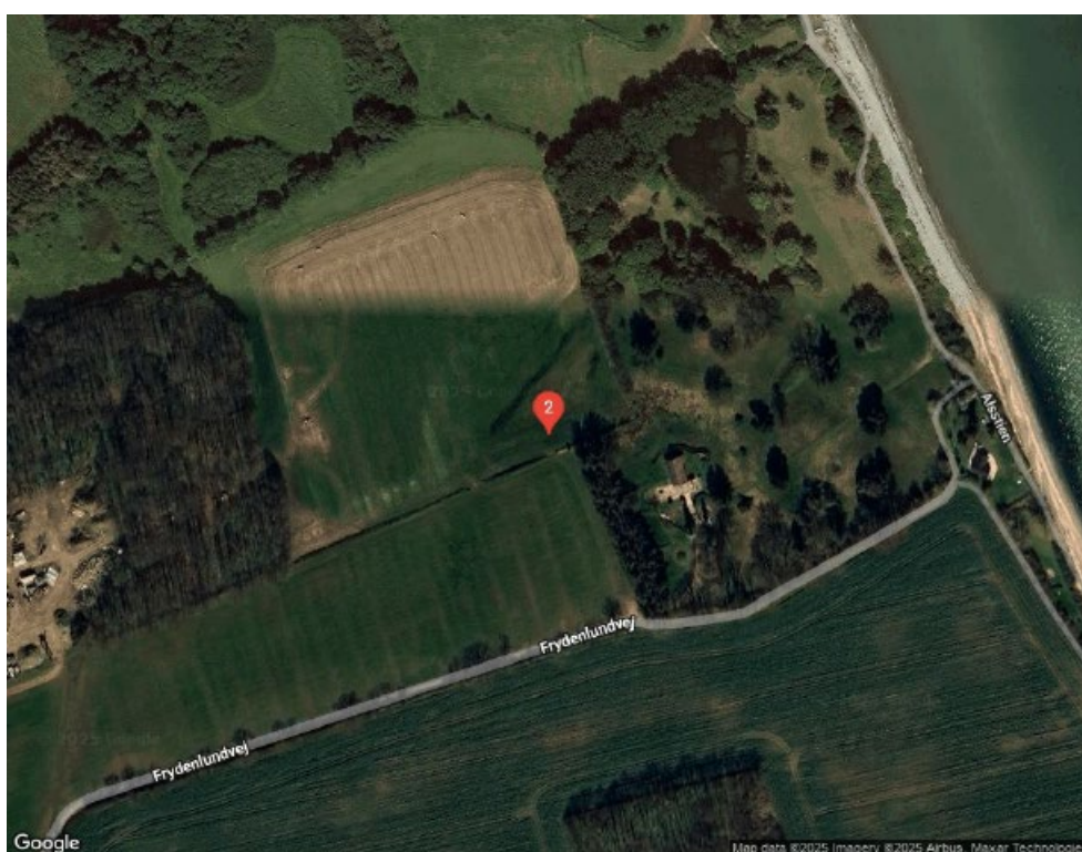
Figur 12. Placering 2