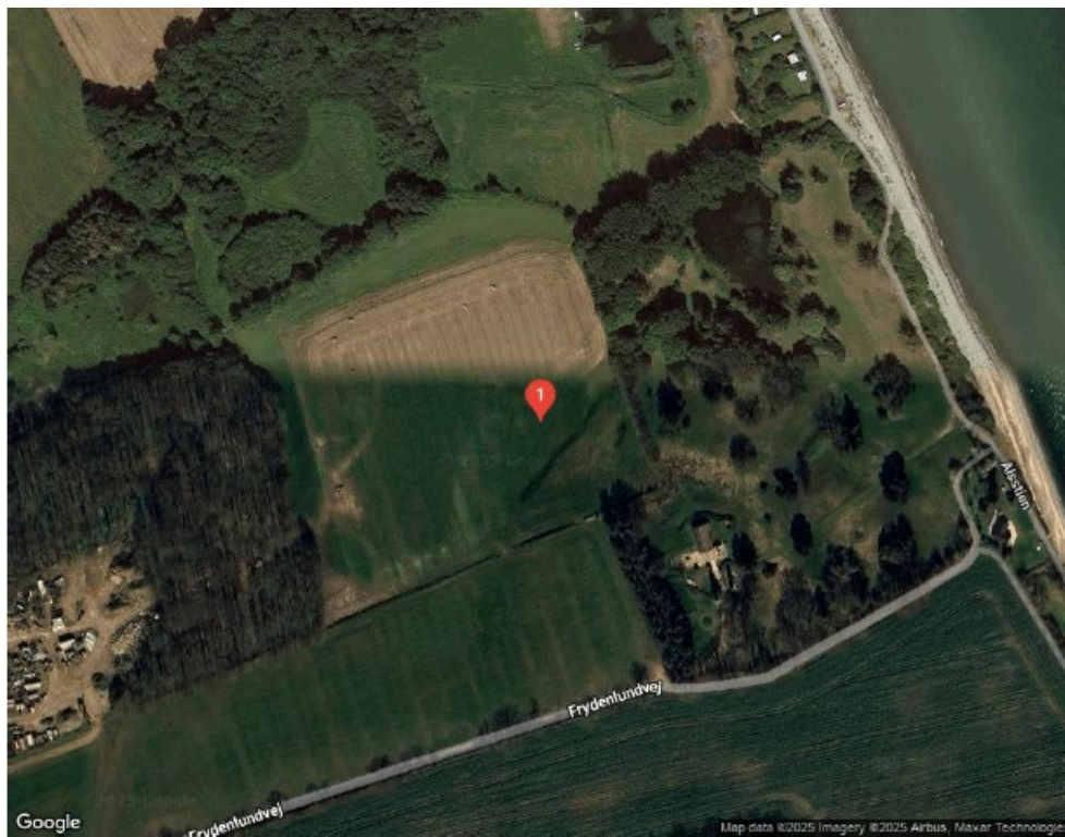
Figur 10. Placering 1