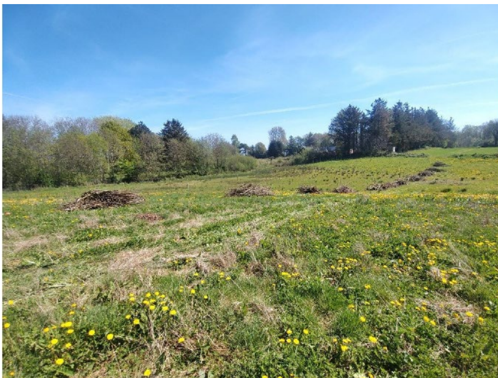
Figur 15. Kvasbunker ved placering 3