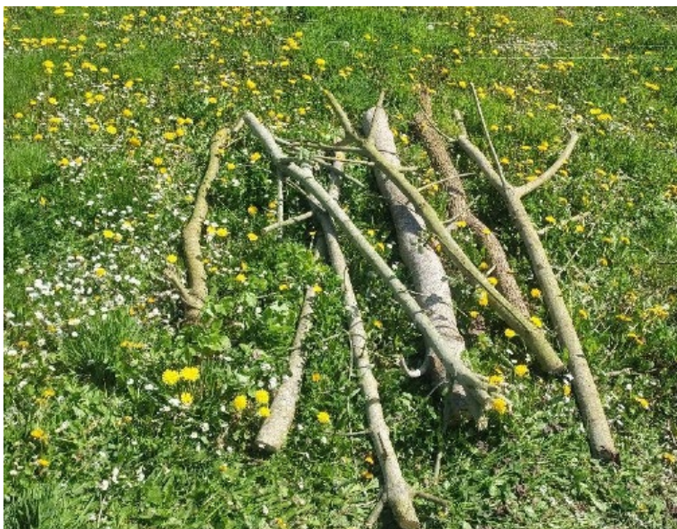
Figur 11. Kvasbunke ved placering 1