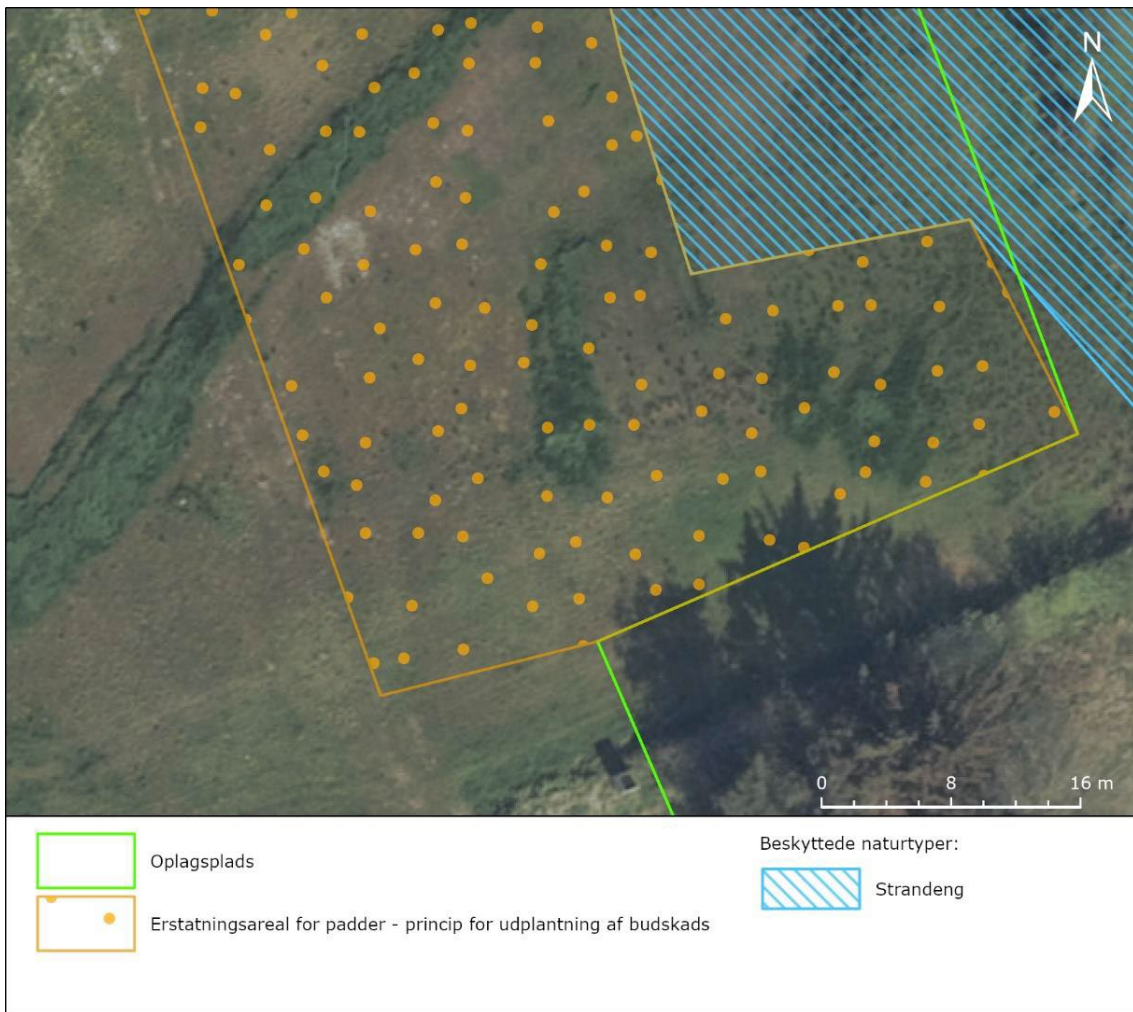
Figur 2. Principskitse for placering af buske på erstatningsareal. Her ses et udsnit af erstatningsarealet.