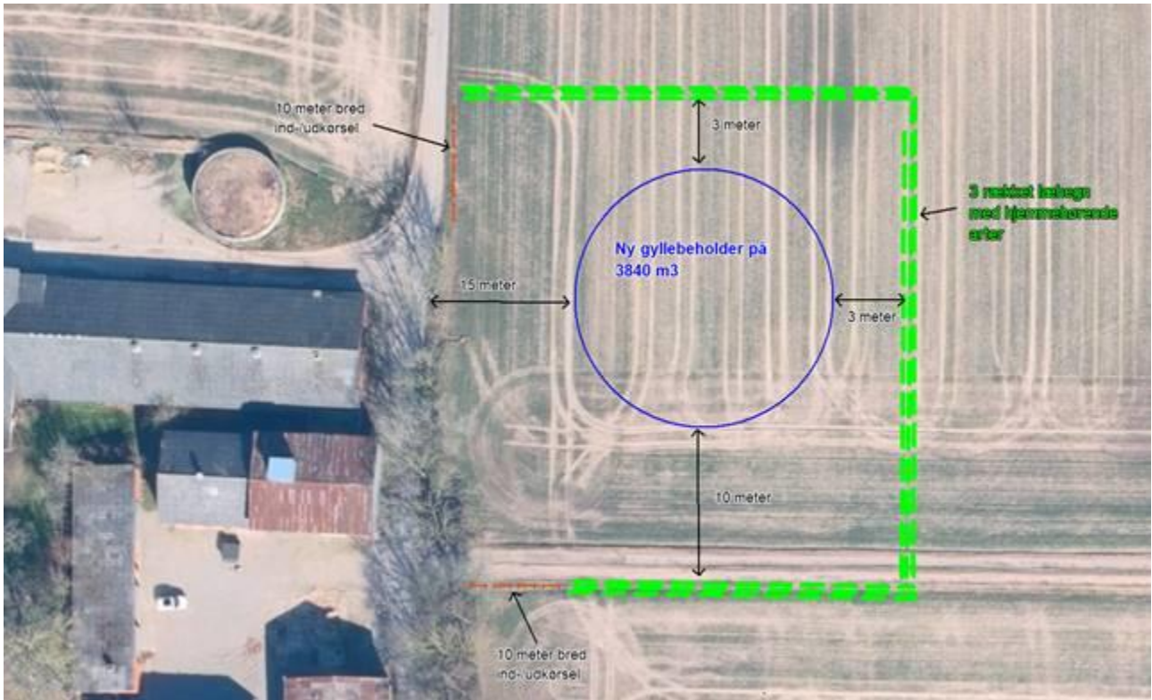
Figur 2: Oversigt over afstande og ønsket afskærmende beplantning ved ny gyllebeholder.