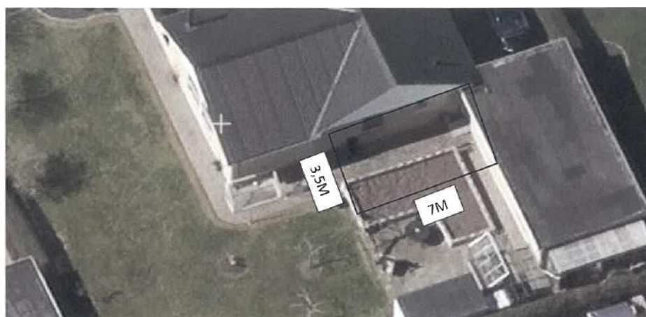
Situationsplan som viser det ansøgte projekt.

Overdækningen placeres mellem husets østlige gavl og garagen. Overdækningen måler 3,5 x 7 m og bliver 2,2 m høj. Overdækningen bygges op af træ og taget beklædes med pvc.