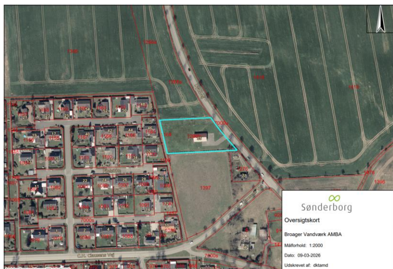
Oversigtskort som viser ejendommen – matr.nr. 1266b, Broager Ejerlav, Broager.

Containeren er uisoleret og skal benyttes til opbevaring af diverse udstyr til vandværket. Mål på containeren: L: 12,19, B: 2,44, H: 2,89.