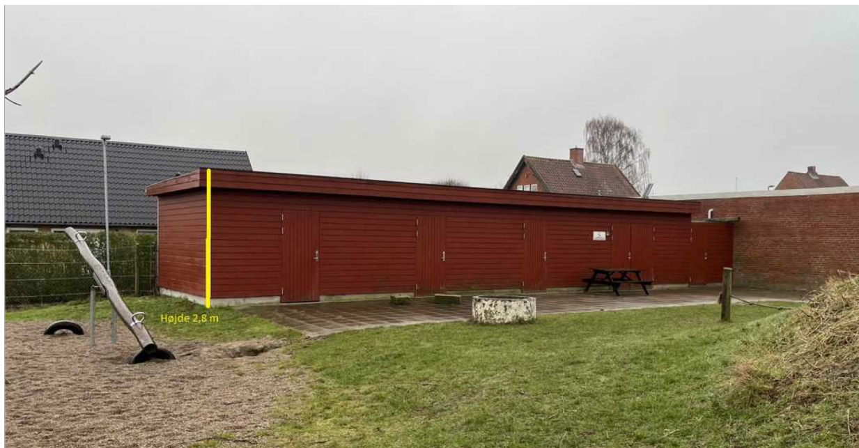
Facade mod nord – ind mod legepladsarealet