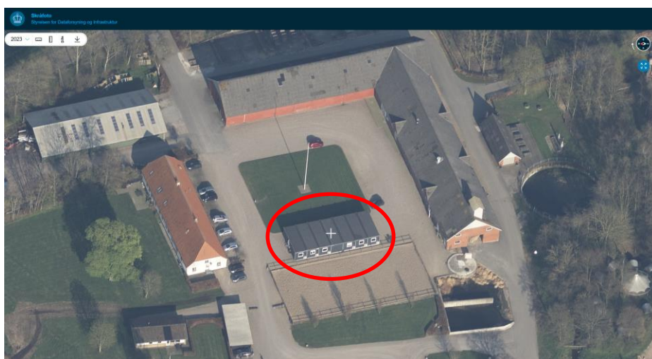
Skråfoto som viser beboelsespavillonen.

Den midlertidige beboelsespavillon anvendes som kollegiebygning for landbrugsskolens elever og landzonetilladelsen ønskes forlænget, da landbrugsskolen stadig oplever massiv tilgang af elever til skolen.