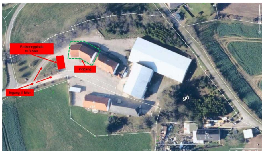
Situationsplan fra ansøgningen – Bygningen som ændrer anvendelse til beboelse med Bed & Breakfast er markeret med grøn stiplede firkant.