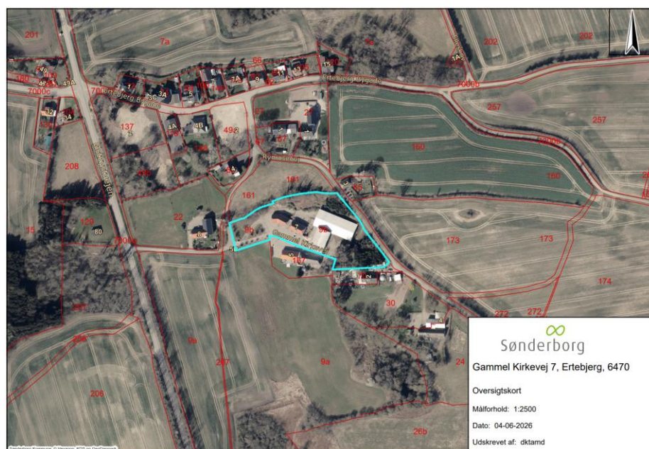
Oversigtskort som viser ejendommens placering i Ertebjerg - illustreret med turkis markering.

Du har søgt om landzonetilladelse til ændret anvendelse fra garage til beboelse, hvor der skal etableres Bed & Breakfast, på ejendommen som ligger på adressen Gammel Kirkevej 7, Ertebjerg, 6470 Sydals.