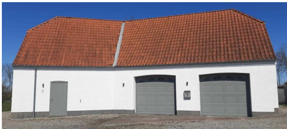
Billede af garagen inden anvendelsesændring.