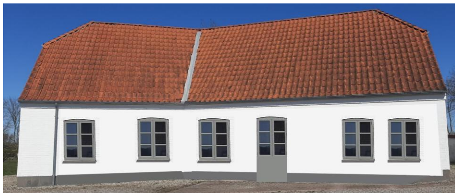
Illustration af bygning efter ombygning og anvendelsesændring.