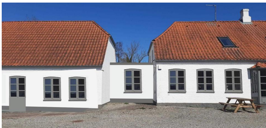
Illustration af bygninger bygget sammen. Den lille mellembgning vil være nyopførelse