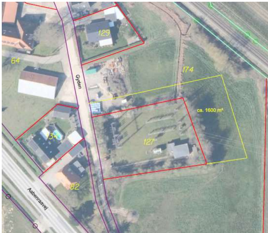
Rids fra ansøgningen, som viser areal til udvidelse af transformerstationen (gul streg).

Sønderborg Kommune afgør, at det ikke kræver landzonetilladelse at udvide den eksisterende transformerstationen med ca. 1600m 2 .