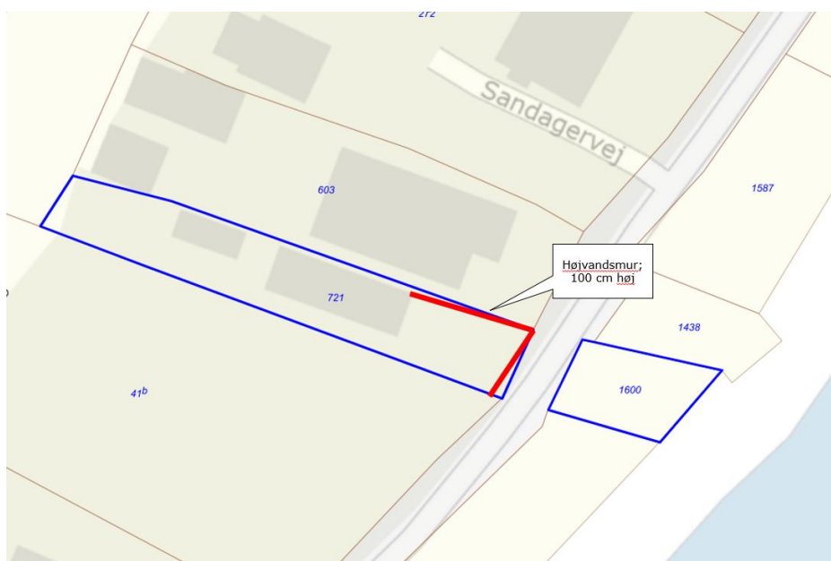
Figur 2: Plantegning med højvandsmurens placering (rød linje)

Yderligere projektbeskrivelse fremgår af ansøgningsmaterialet, som er vedhæftet.