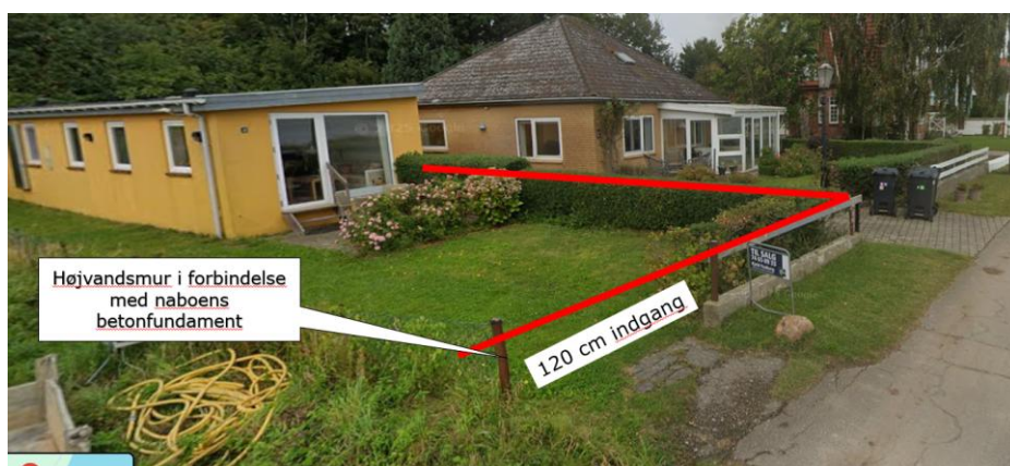
Figur 3: Foto, der viser murens placering. Der er i dag en støttemur rundt om naboens grund nederst i billedet, som muren bygges i forbindelse med.