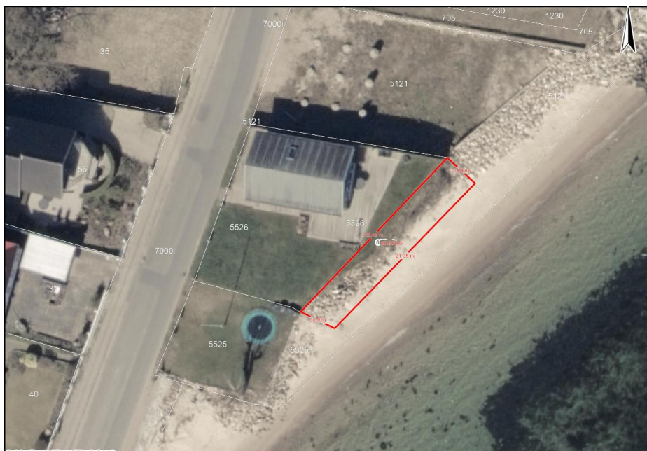
Figur 2: plantegning over anlæggets placering og udstrækning (rød figur)

Detailkort og yderligere projektbeskrivelse fremgår af ansøgningsmaterialet, som er vedhæftet.