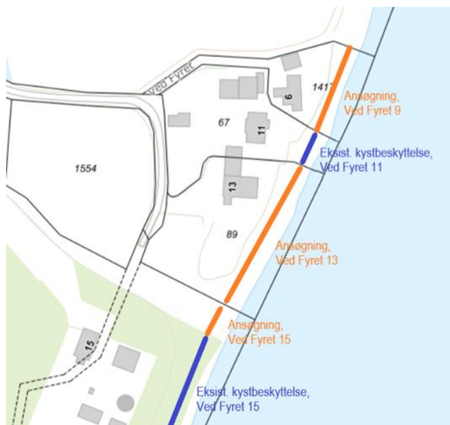
Figur 2. Skematisk oversigt over placeringen af det ansøgte

Detailkort og yderligere projektbeskrivelse fremgår af ansøgningsmaterialet, som er vedhæftet.