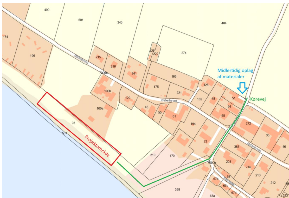
Figur 4 Midlertidig opbevaring af materialer og kørevej til projektområdet.