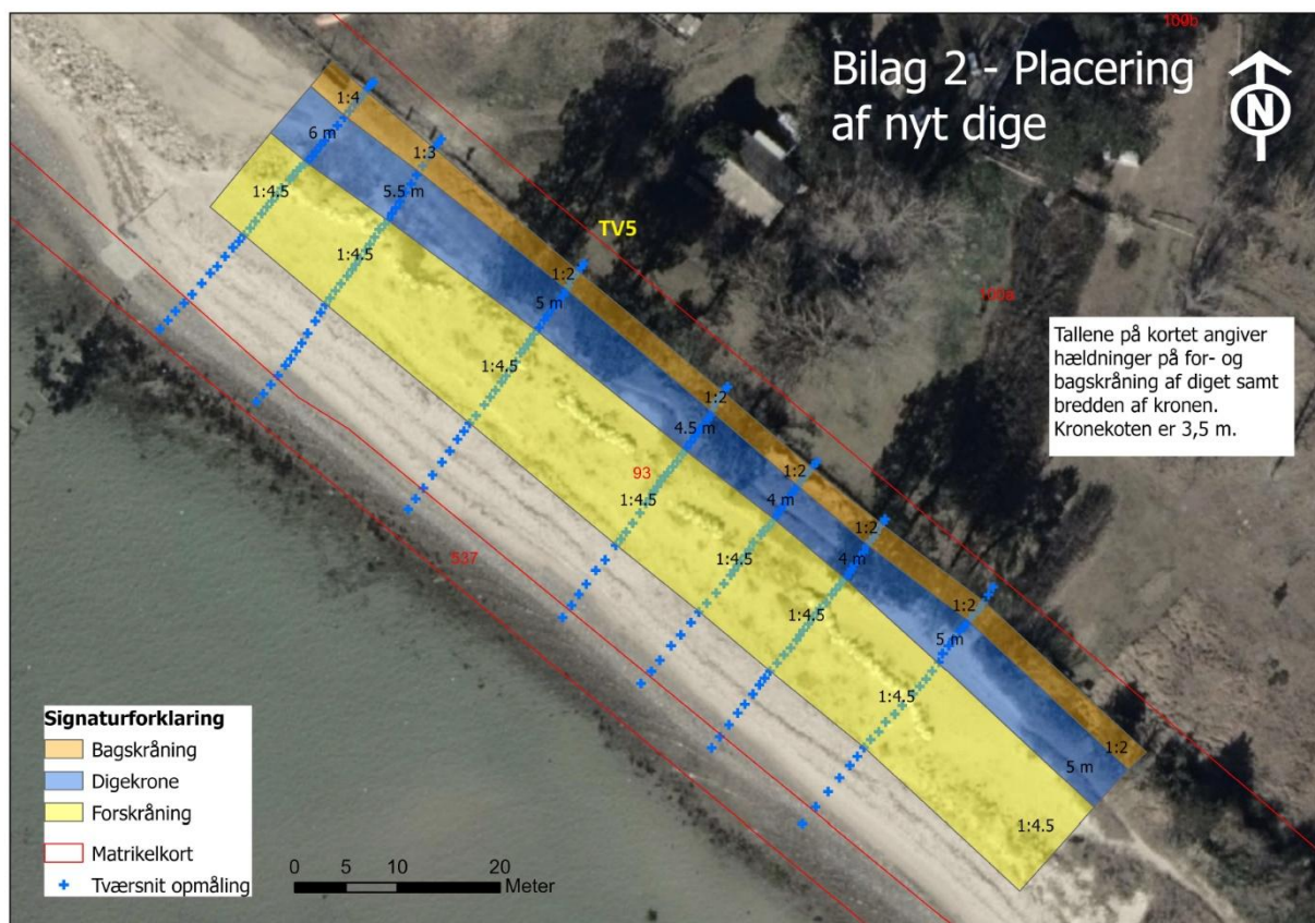
Figur 2 Placering af det nye dige. Den gule firkant viser placeringen af digets forskråning, den blå forkant viser digets krone (top) og den orange firkant viser digets bagskråning. De blå krydser viser hvor der lavet opmålinger med GPS. Tværsnittet i figur 3 er placeret ved "TV5".