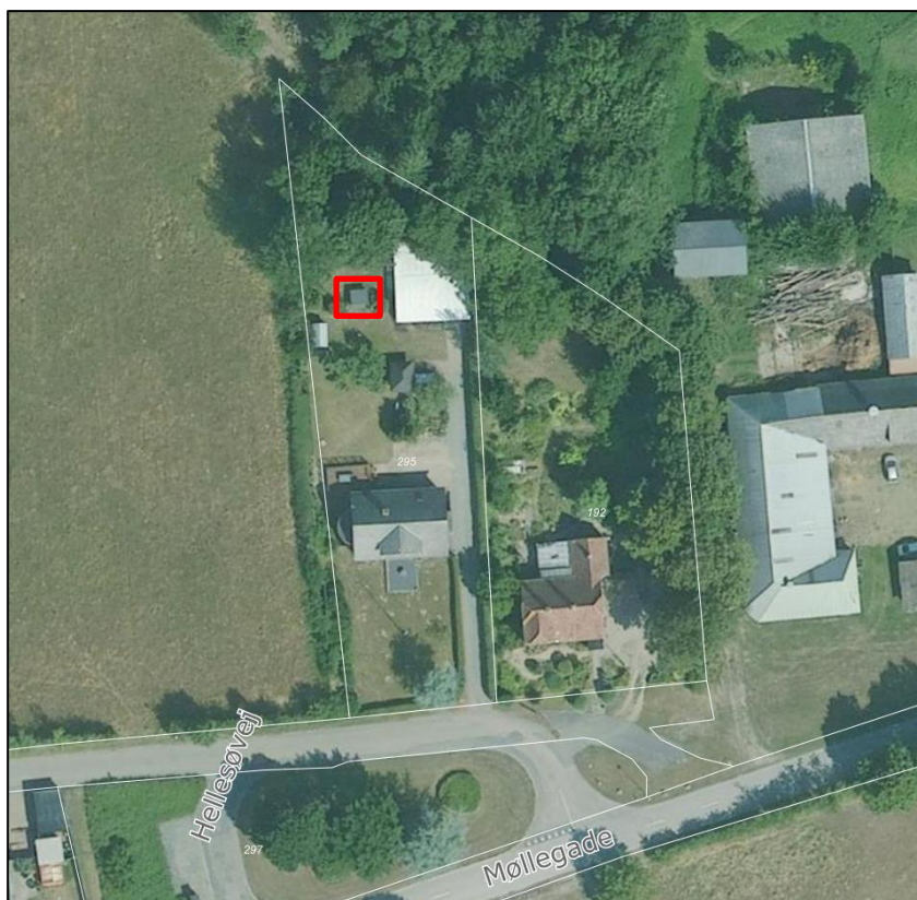
Shelterets beliggenhed markeret med rød på matr.nr. 295, Holm, Nordborg