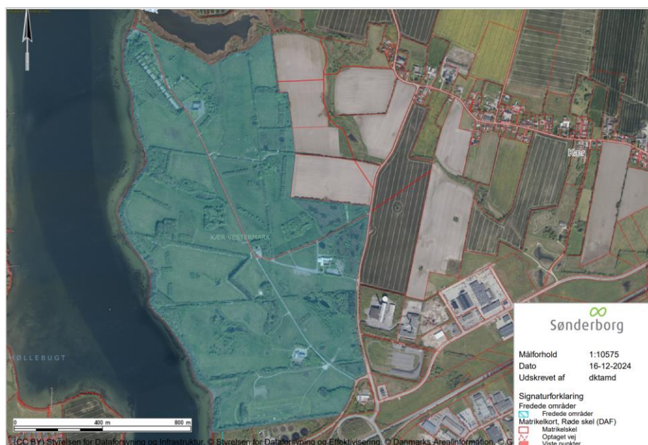
Oversigtskort som viser Kær Vestermark.

Det rekreative område Kær Vestermark ligger indenfor strandbeskyttelseslinjen og er arealfredet med fredningsnummer: 0820100.