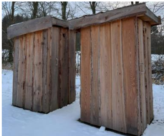
Modelbillede af de muldtoiletter som opføres.