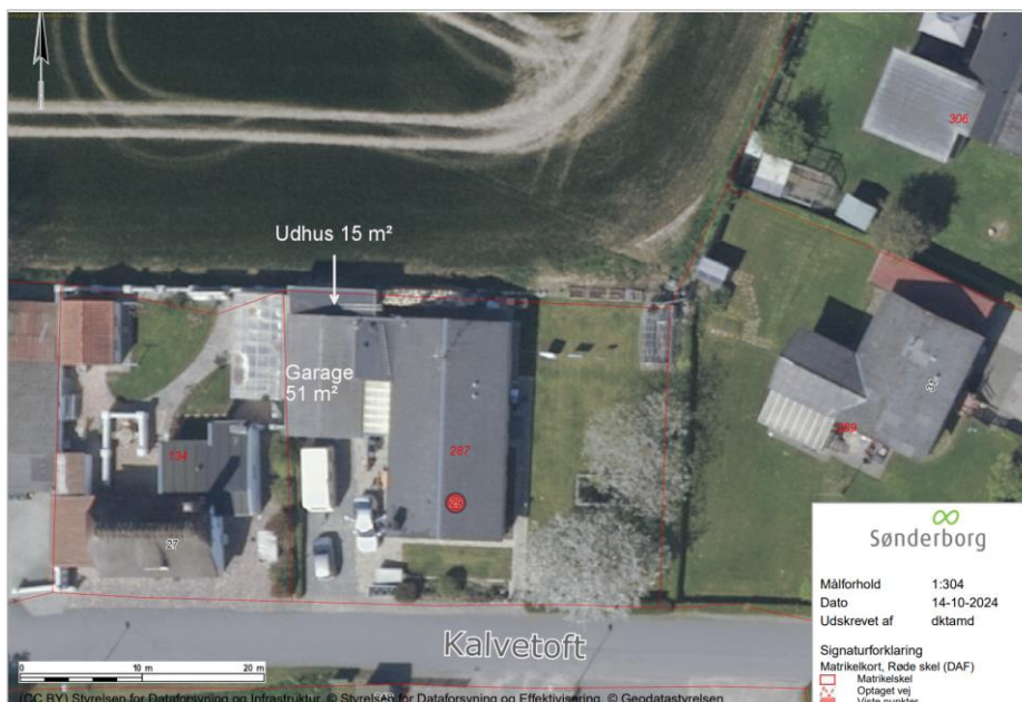
Situationsplan som viser bygningerne – flyfoto forår 2024.

Det opførte udhus på 15 m 2 er bygget sammen med garagen, hvilket giver et samlet areal på 66 m 2 sekundær bebyggelse. Udhuset er opført i træ med tagpap på taget og ligger i skel ud mod marken og nabo.