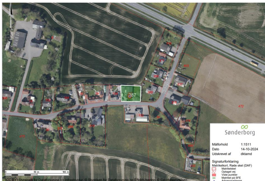
Oversigtskort som viser ejendommens placering på matr.nr. 287, Ullerup Ejerslav, Ullerup.

Du har søgt om landzonetilladelse til lovliggørelse af udhus som er bygget sammen med garagen på adressen Kalvetoft 29, Ullerup, 6400 Sønderborg.