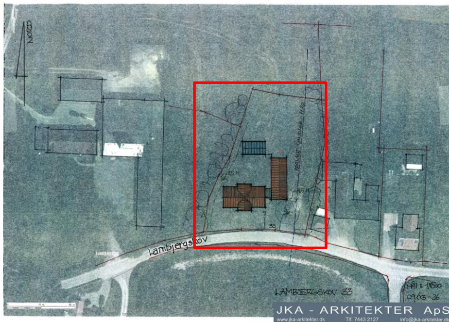
Situationsplan fra ansøgningen.