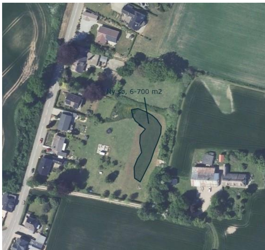
Figur 1: Oversigtskort med placering af ønskede sø. Kort fra ansøger.