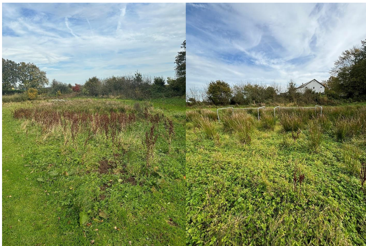
Figur 2 Fotos fra besigtigelsen 17-10-2024

Ca. 250 m øst for arealet findes der et større sammenhængende §3 område med mose, eng, overdrev og strandeng. I en radius af ca. 1 km findes der også flere søer med registreringer af stor og lille vandsalamander, butsnudet frø og skrubtudse.