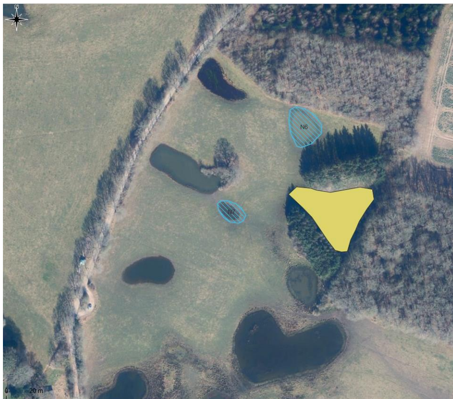
Figur 1: Oversigtskort med placering af de nye vandhuller. Vandhullerne er markeret med blå skravering. Den gule flade angiver placeringen af opgravet jord. Kortet er indsendt af ansøger.

Efter §35 må der i landzone bl.a. ikke ske ændringer i anvendelsen af ubebyggede arealer uden forudgående tilladelser fra kommunen. Ved meddelelse af landzonetilladelse skal landskabelige og naturmæssige værdier tilgodeses.