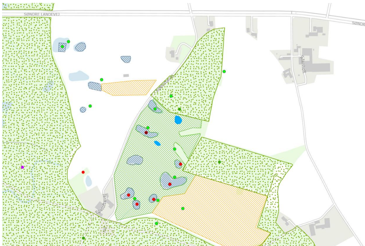
Figur 4: Kort over beskyttet natur i området omkring matriklen. De nye søer er indtegnet med blå. De skraverede områder er §3 beskyttet natur: grøn = eng, mørkeblå = sø, gul = overdrev. Det grønne prikkede er fredskov. De lysegrønne prikker er løvfrø,