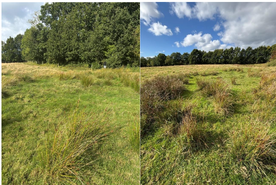
Figur 2 Fotos fra besigtigelsen 22-09-2025: Venstre: Lavning hvor vandhul N6 skal være. Højre: Lavning hvor vandhul N7 skal være. Begge lokaliteter har lignende vegetation domineret af græsser og lysesiv.