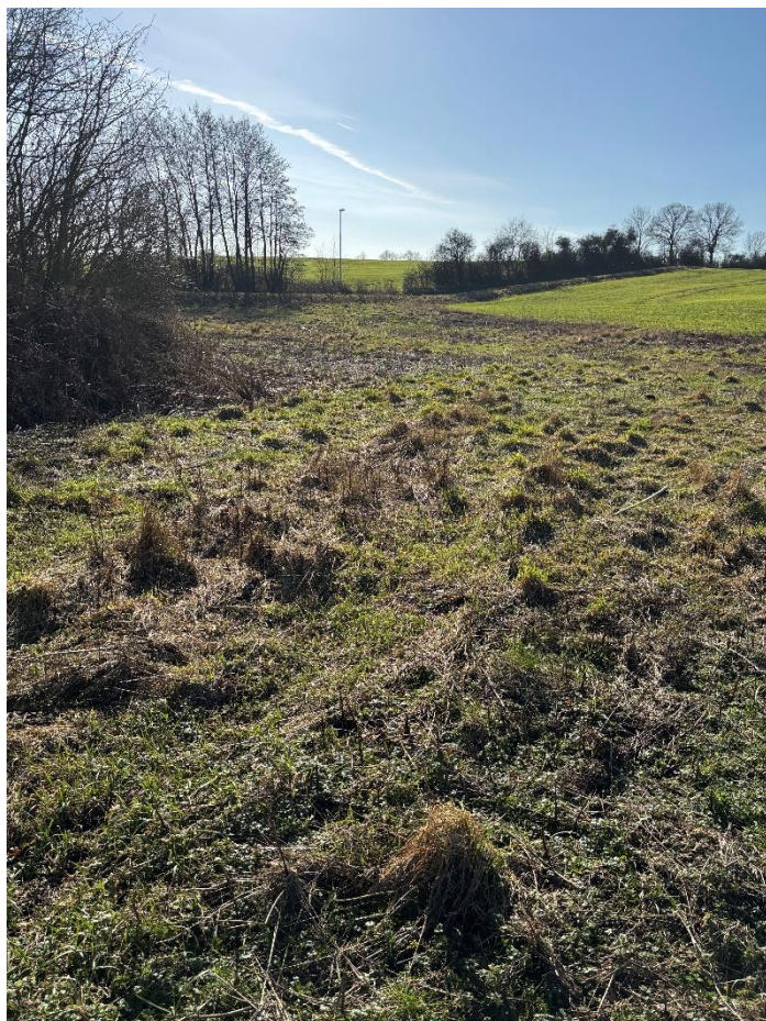
Figur 2 Foto fra besigtigelsen 03-03-2026, i sydlig retning.