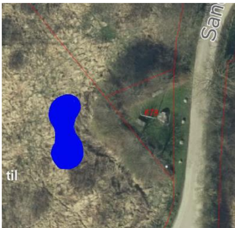
Figur 1: Oversigtskort med placering af ønskede sø. Kortet er indsendt af ansøger

Ved meddelelse af landzonetilladelse skal landskabelige og naturmæssige værdier tilgodeses.