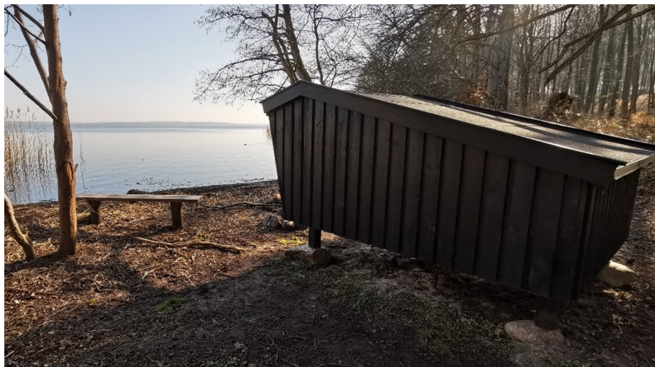
Figur 1 - Mini shelter opsat i Nordsjælland

Du har søgt om tilladelse til at opføre et mini shelter med plads til 4 sovende gæster. Opsætningen af mini shelteret er en del af et projekt, hvor der opføres 16 mini sheltere med støtte fra A.P. Møller fonden. Alle sheltere vil være fuldt tilgængelige for offentligheden og vil derved udbygge mulighederne for naturoplevelser på en måde, som både er tilgængelig og gratis for brugerne, på arealer som alle har adgang til.