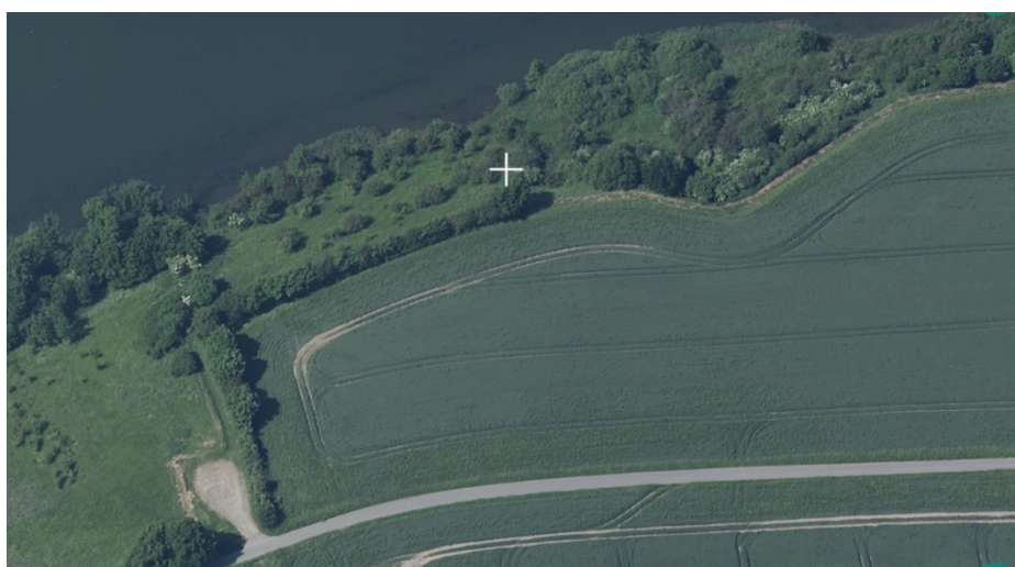
Placering af mini shelter markeret med hvidt kryds – Nord er ud mod Oldenor sø.

Du skal være opmærksom på, at denne afgørelse kun er givet i forhold til planloven og naturbeskyttelsesloven.