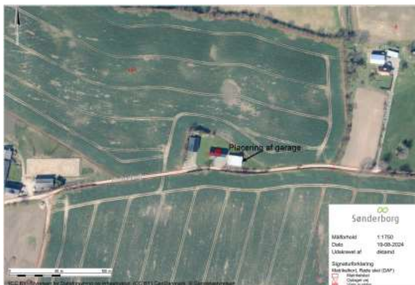
Oversigtskort som viser ejendommen – matr.nr. 492, Kværs Ejertlav, Kværs.

Du har søgt om landzonetilladelse til at opføre en garage på 42 m 2 , på ejendommen som ligger på adressen Limbækvej 7, Kværs, 6300 Gråsten.