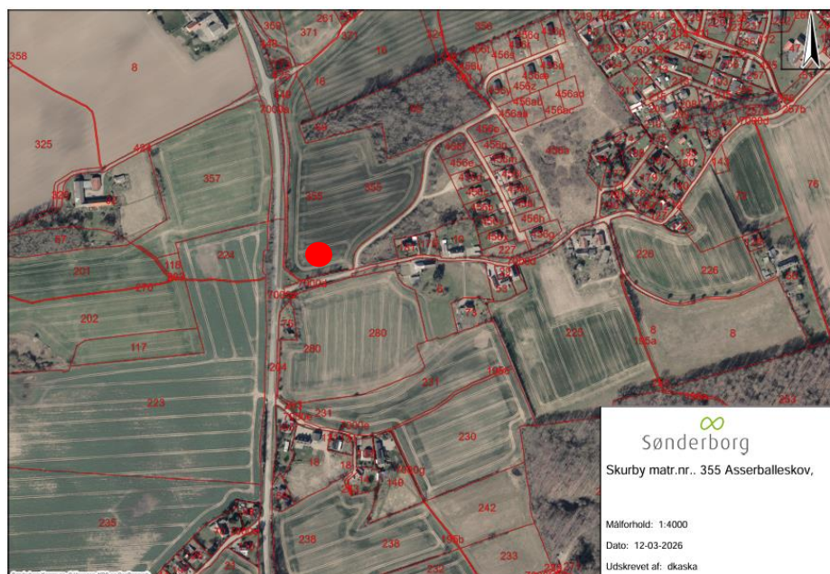
Oversigtskort som viser ejendommen – matr.nr. 355, Asserballeskov, Asserballe.

I forbindelse med spildevandskloakering af Nørre Kettingskov er der behov for en midlertidig skurby/jordoplæg/karteringplads. Arealet udgør ca. 3500 m 2 med en placering ud mod Nørre Kettingskov, Østkystvejen og Havemose, hvorfra der er ind- og udkørsel.