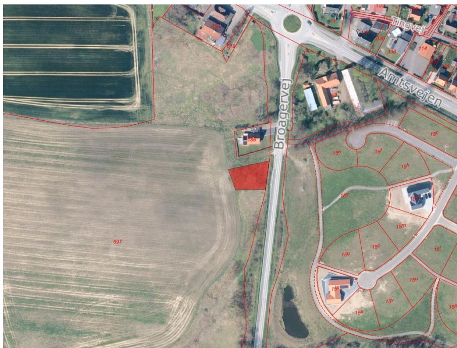
Oversigtskort som viser byggepladsens placering (markeret med rødt) på matrikelnr. 697 Nybøl Ejlerlav, Nybøl.

Amtsvejen 13-21 i Nybøl skal separatkloakeres og der skal etableres et regnvandsbassin til håndtering af overfladevandet. Samtidigt skal der flyttes en pumpestation for at optimere driften. Der etableres derfor en midlertidig byggeplads på matrikelnr. 697 Nybøl Ejlerlav, Nybøl, hvor størstedelen af de ovenstående arbejder skal udføres.