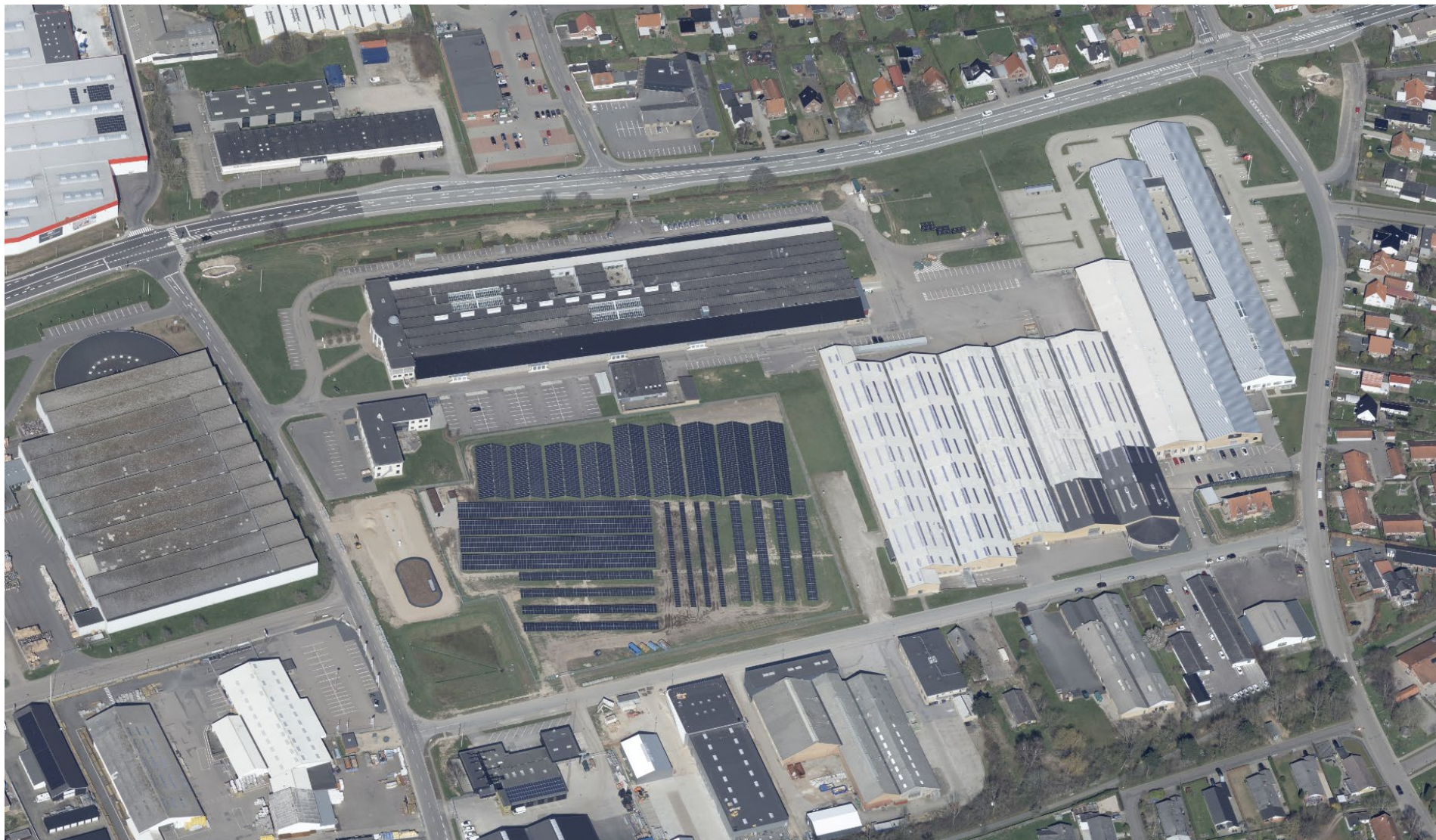
Prosjektområdet set fra luften (foto fra 2023).