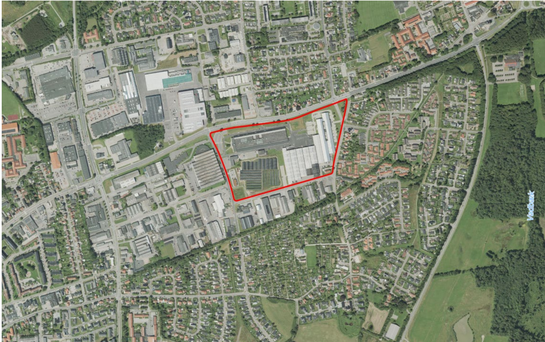
Projektområdets afgrænsning og placering i forhold til Sønderborg by.