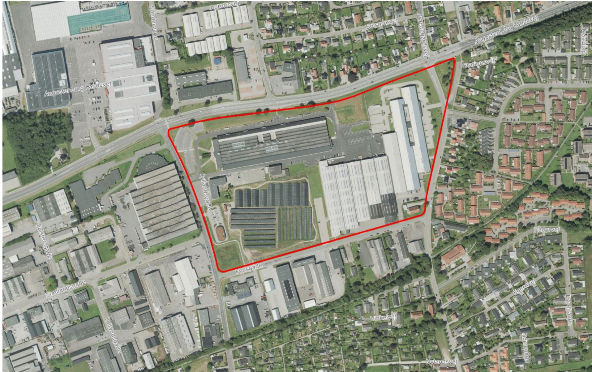
Projektområdets afgrænsning og placering ved Fynsgade i Sønderborg.