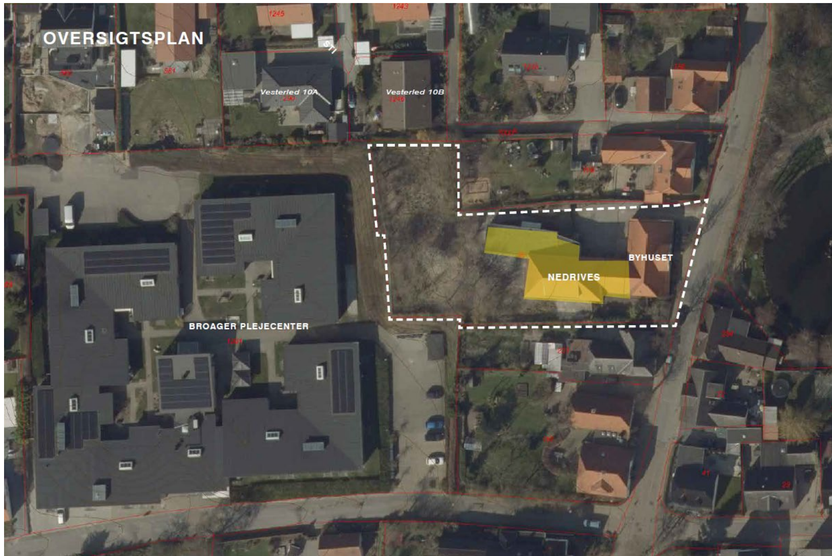
Kortet herover viser lokalplanens afgrænsning med hvid markering. Gul markering angiver den del af bebyggelsen der nedrives.